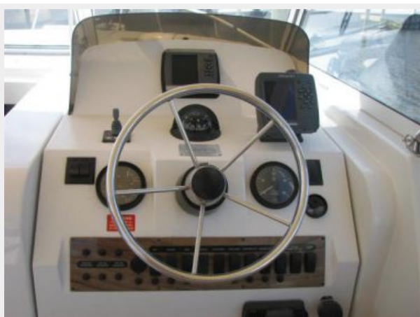
Helm / Electronics & Navigation