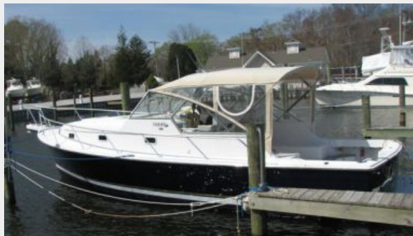
Profile 2 - Port