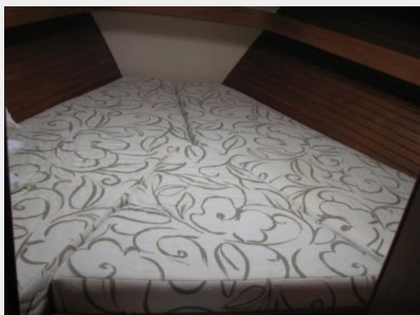
Master Stateroom 1 - Forward Berth