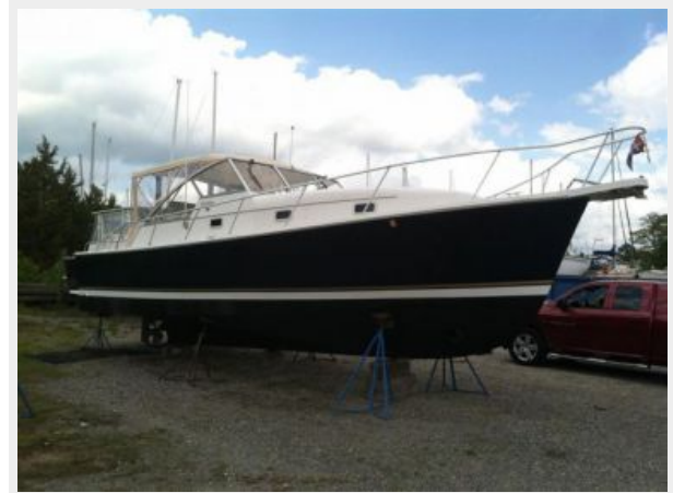
Profile 3 - Forward Starboard