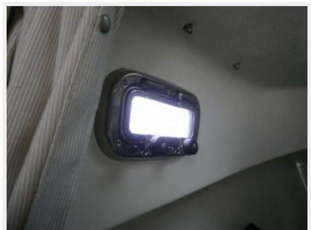
6 Stainless Steel opening ports