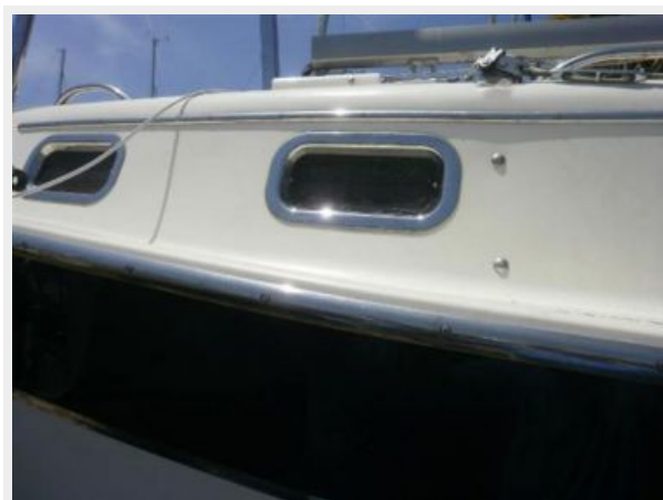
Stainless Steel Portholes