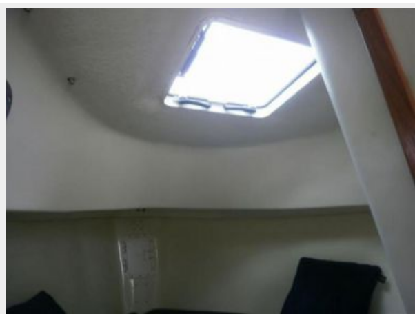
Overhead Hatch in Forward "V"