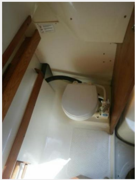
Stand up head with Holding Tank