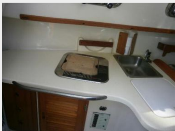
Cover on Stove trash holder under white cover