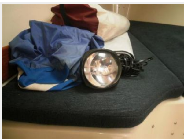
Main & Genoa plus 12Volt Spotlight