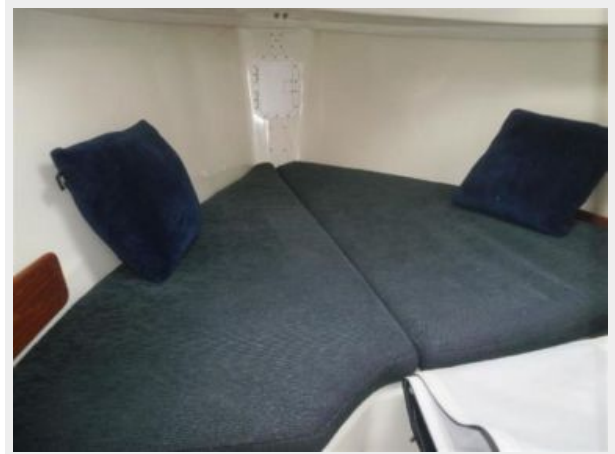
Forward "V" for a Double