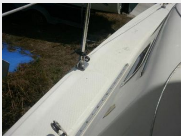
Standing Rigging is in excellent shape