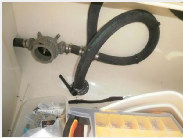
"Y" Valve for holding tank