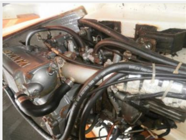
Yanmar 2GM Diesel (Top View)