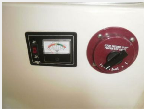
Battery Tester & A/B Selector