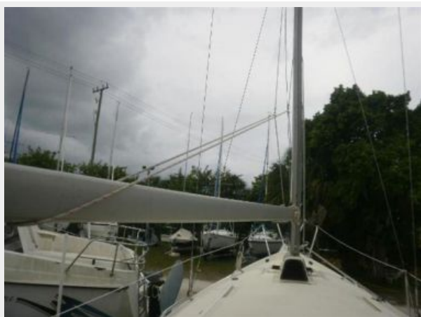
Boom w/Lazy Jacks