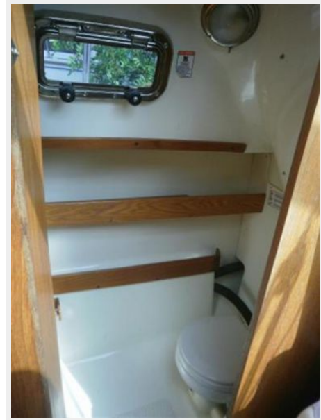
Port Hole plus solid door in head