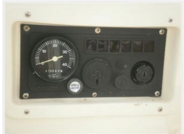
Engine Instruments & Warning Lights