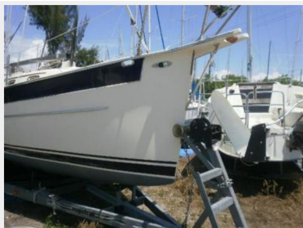
Bow Sprit & Trailer Steps