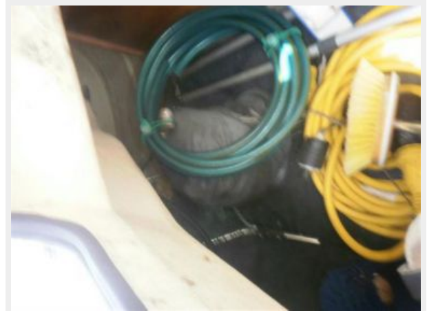
Storage Locker Starboard Side