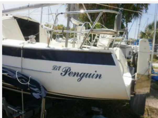
Lil Penguin w/Rudder in up position