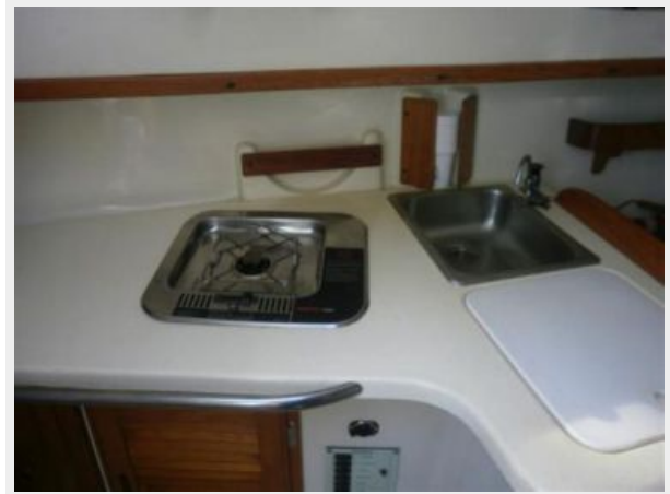
Origo 2000 Stove & Sink with hand pump