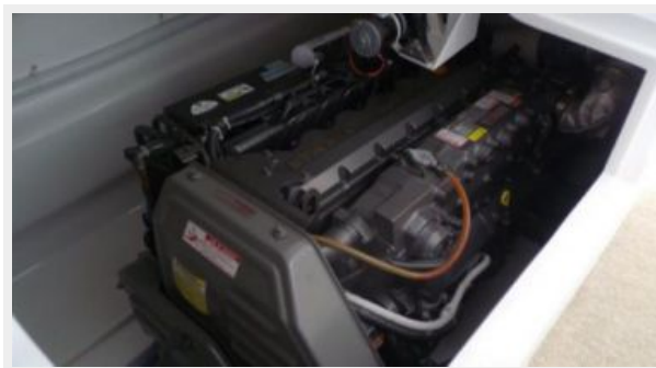
Engine & Mechanical Equipment 1