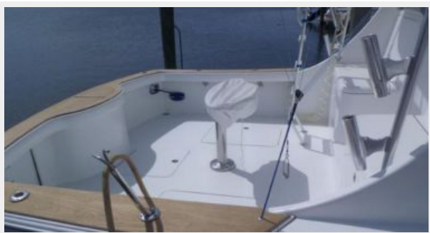
Cockpit / Fishing Equipment 1 - Cockpit