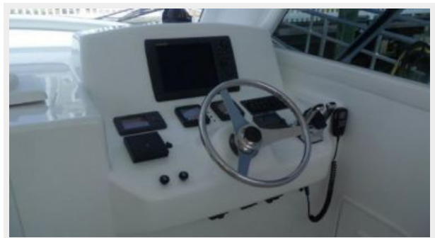
Helm / Electronics & Navigation 1