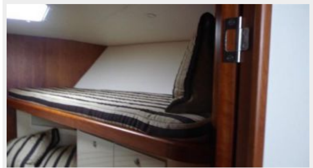
Master Stateroom 2