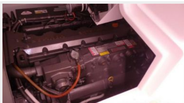
Engine & Mechanical Equipment 2