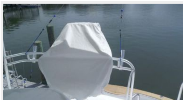
Helm / Electronics & Navigation 4