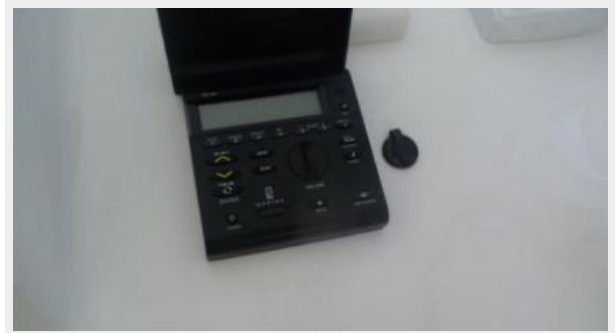
Helm / Electronics & Navigation 3