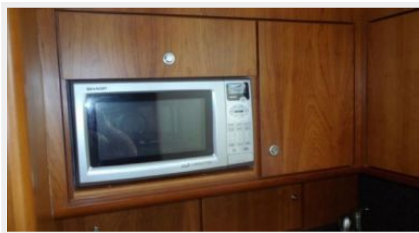
Galley 2 - Microwave Oven / Convection Oven