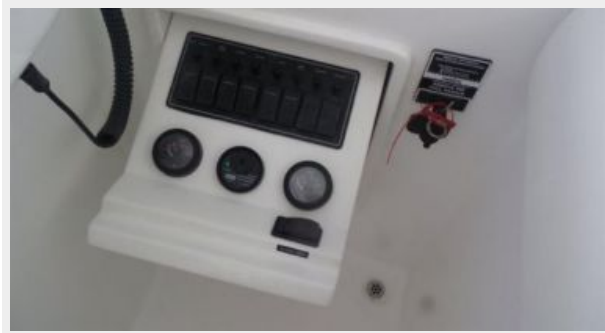
Helm / Electronics & Navigation 2