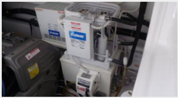
Engine & Mechanical Equipment 4