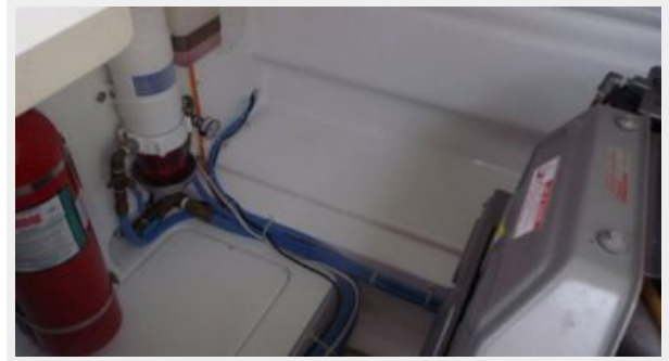
Engine & Mechanical Equipment 5