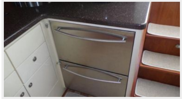
Galley 1 - Refrigerator & Freezer