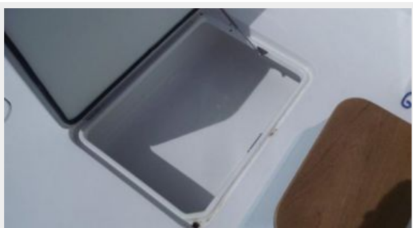
Cockpit / Fishing Equipment 5