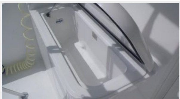
Cockpit / Fishing Equipment 3