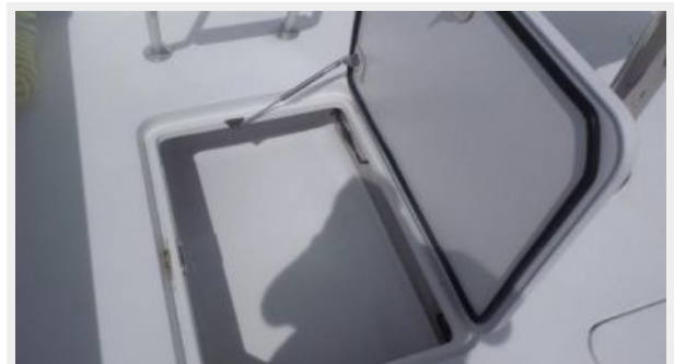
Cockpit / Fishing Equipment 4