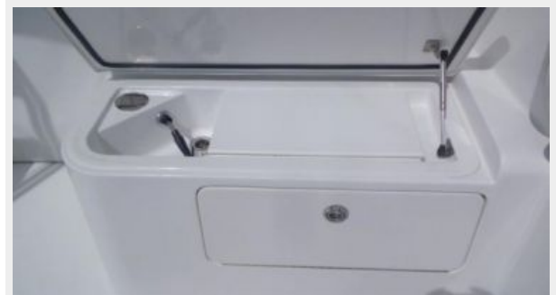
Cockpit / Fishing Equipment 2