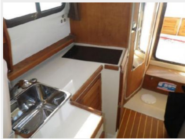
GALLEY TO AFT