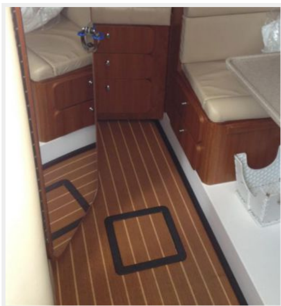
Main Cabin 3 - Teak Flooring