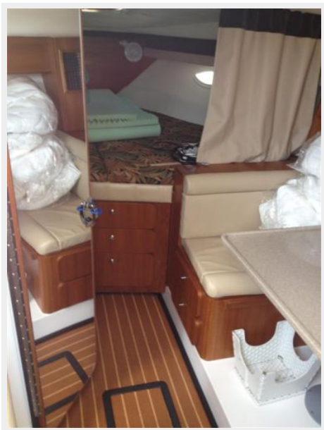
Main Cabin 1 - Forward Berth