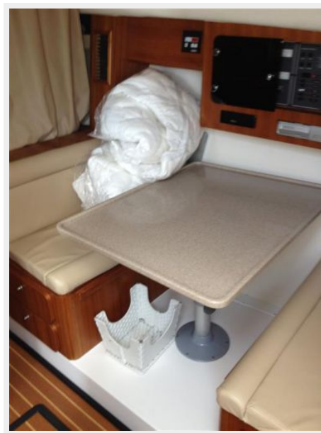
Main Cabin 2 - Dinette