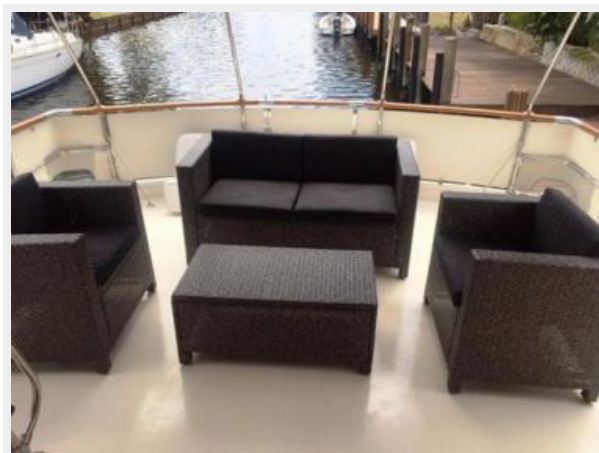
Salon aft deck area