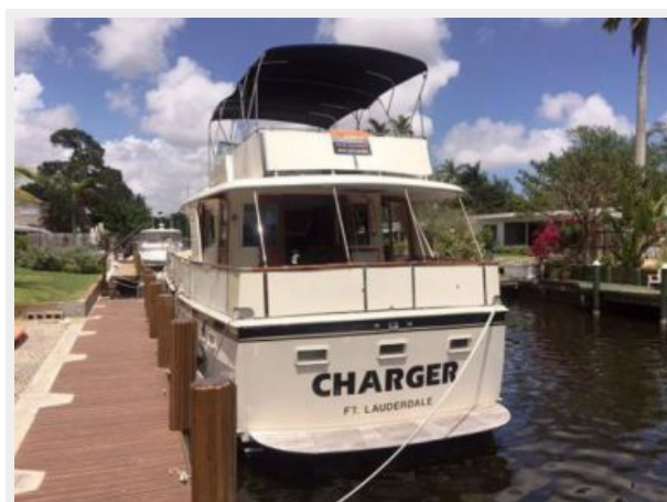
Port Stern view