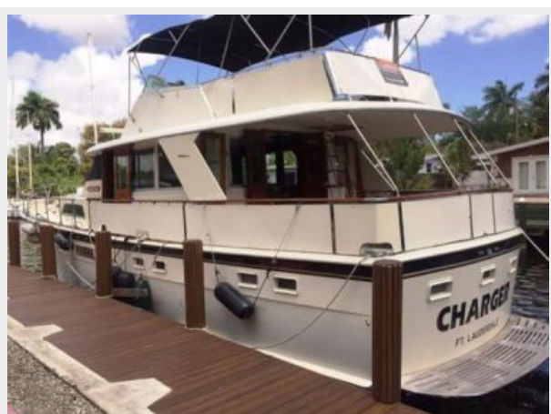
Port mid boat