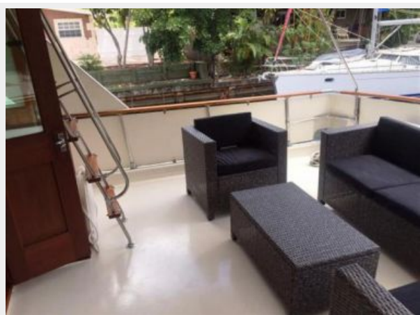
Salon aft deck and staircase to Bridge