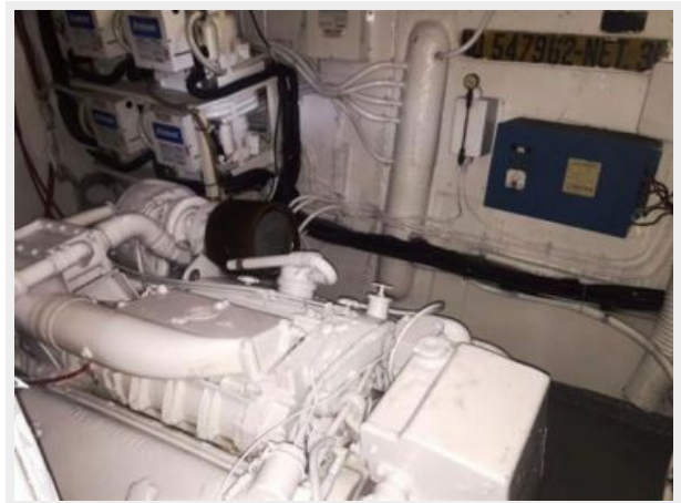
Port engine room