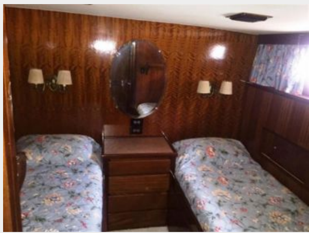
Aft Guest Stateroom