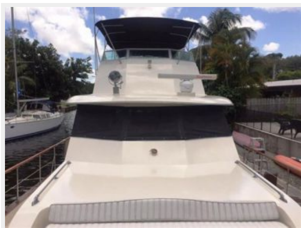
Fore-deck Seating and Bridge Bimini