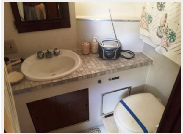
V-berth cabin head