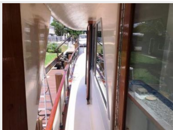
Port covered walkway