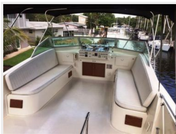
Upper Helm and seating