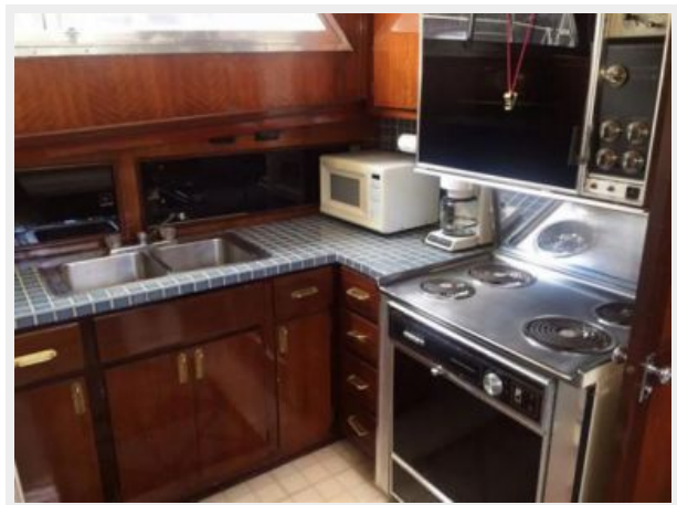
Galley double sink and stove with oven