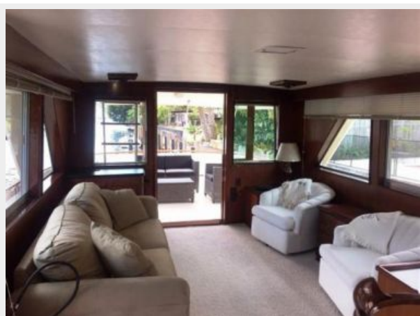
Salon looking aft