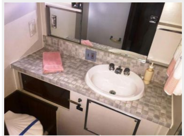
Aft Guest head