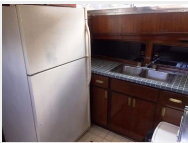
Galley with full size refrigerator & Freezer