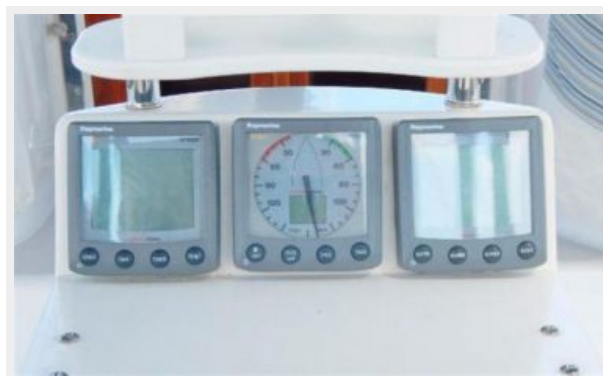
Speed, Depth, Wind