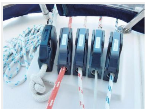
Rope Clutches Port