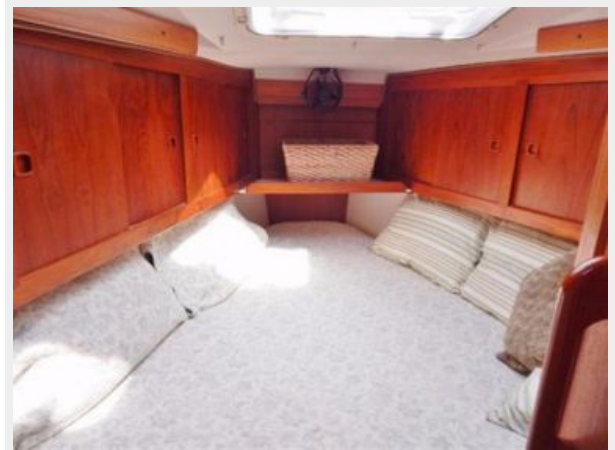
Guest Berth Forward