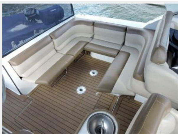
Cockpit U Shape Seating