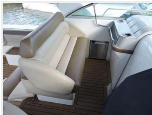
Port Double Seat