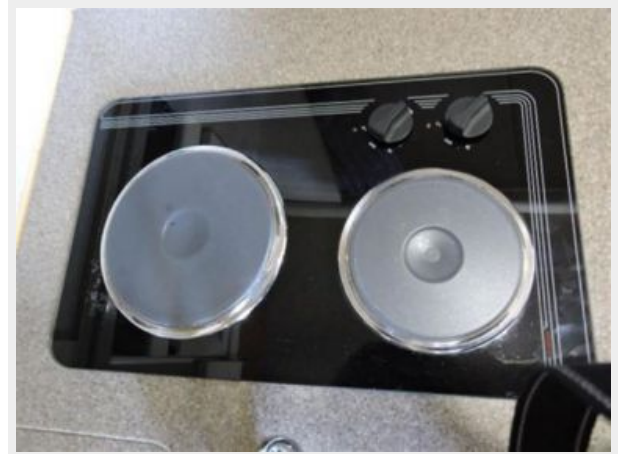
Two Burner Stove