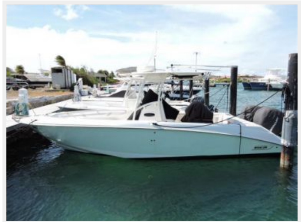
Boston Whaler 270 for sale in the Curacao