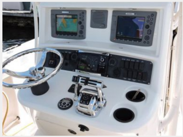
Boston Whaler 270 with Mercury Outboard