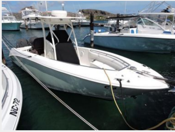
Boston Whaler 270 for sale in the Dutch Caribbean