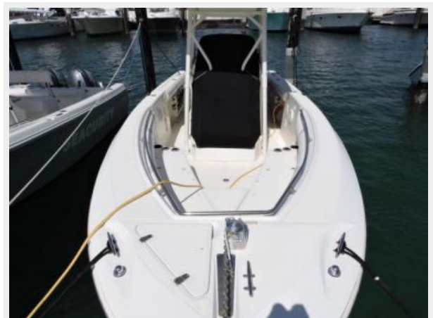
Boston Whaler 270 with Vessel view 7