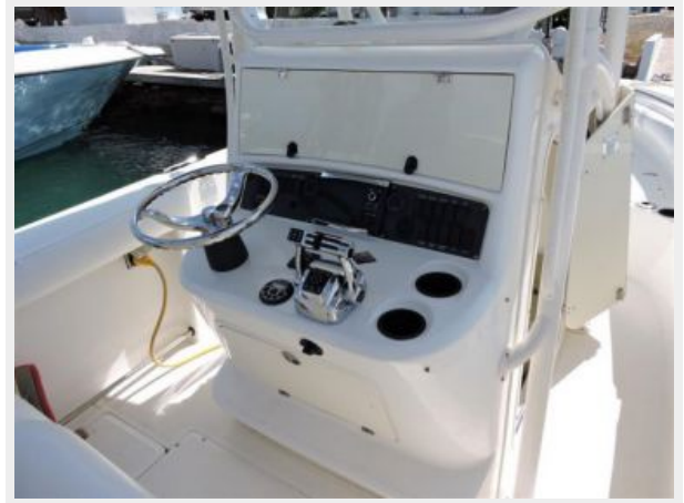
Boston Whaler 270 with Center Cockpit