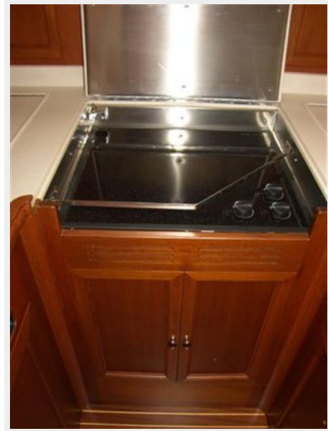
Galley 3 Burner Stove