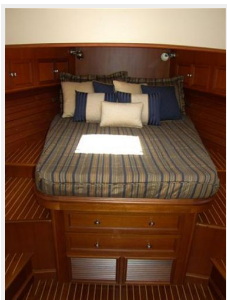
Centerline Master Berth