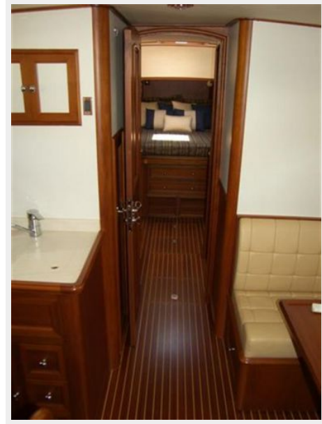
Companionway looking forward