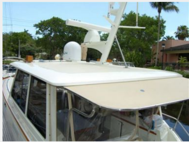
Canvas Overhang Extension