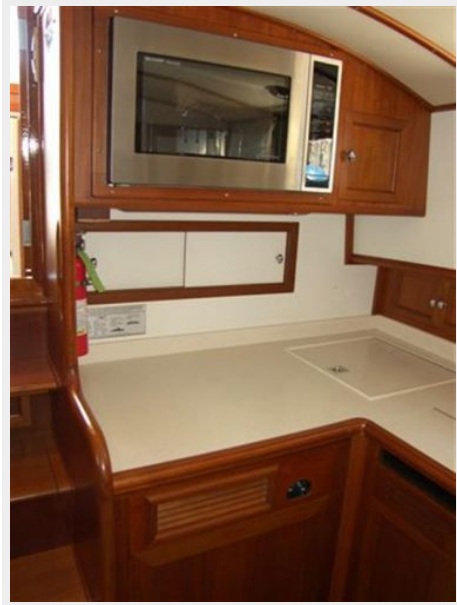
Galley to port