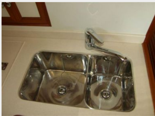
Double S.S. Sink