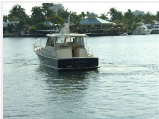
Fresh Bottom April 2015