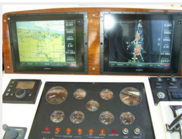
New Electronics April 2015