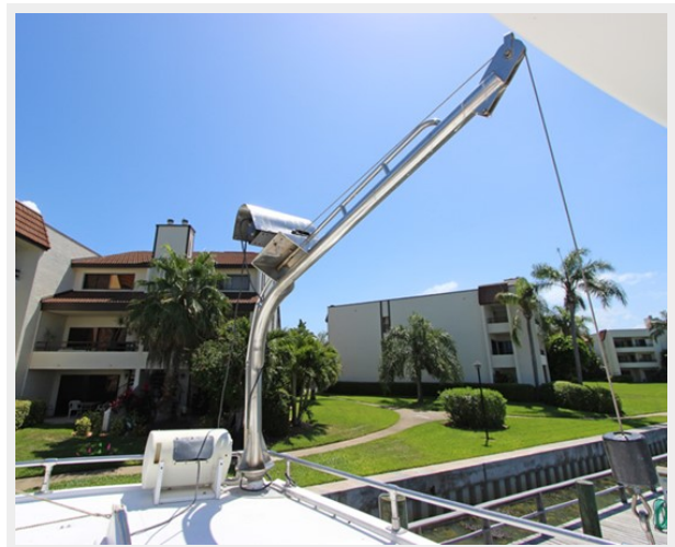
Electric Stainless Dinghy Davit