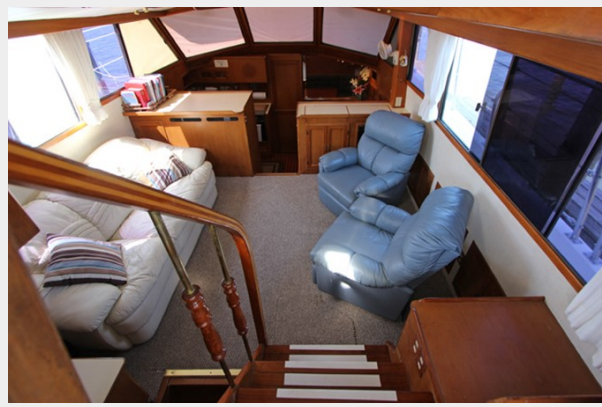
Salon Looking Forward From Companionway