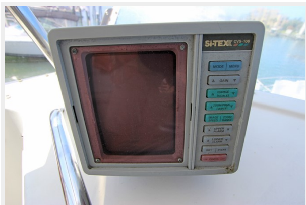
SI-TEX Bottom Machine/Sounder