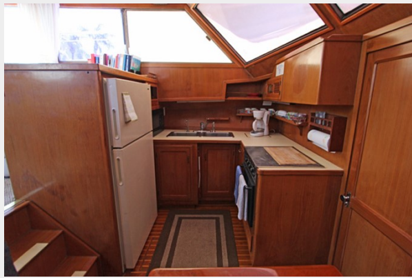
Full Galley w/Refrigerator & Freezer, Stainless Sink, Stainless Oven w/Cooktop, & Microwave