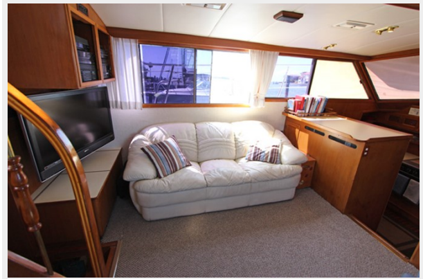
Salon To Port