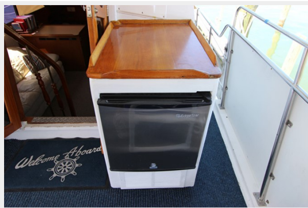
Aft Deck Fridge