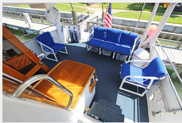
Aft Deck Looking From Flybridge