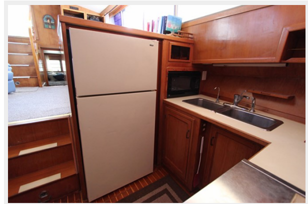
Standard Size Refrigerator