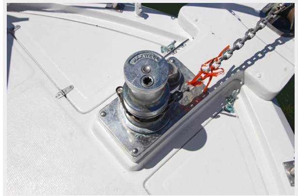
Maxwell Stainless Electric Windlass