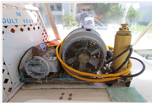
Air-Compressor For Filling Dive Tanks