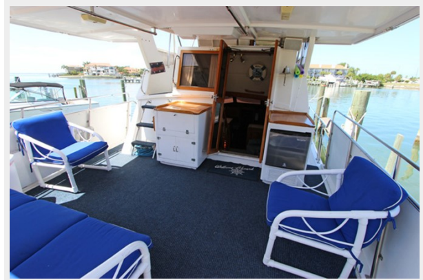
Aft Deck Looking Forward