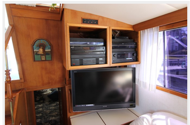
Salon Entertainment Center