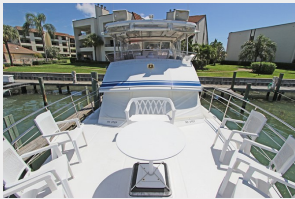
Bow View Looking Aft