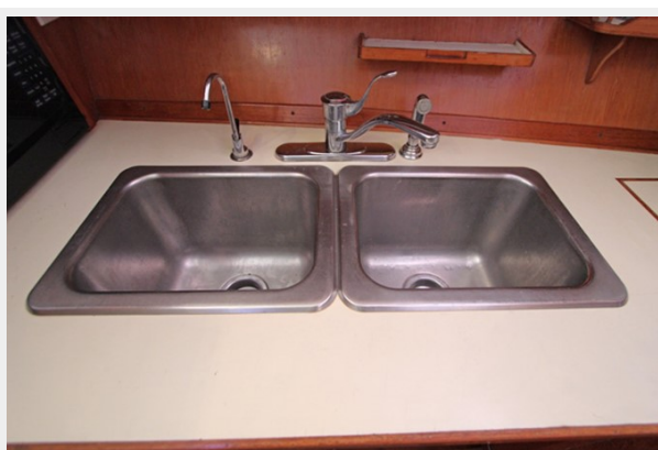
Double Stainless Sink