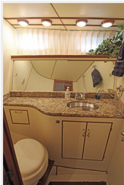
Guest Head W/Electric Toilet & Granite Countertop