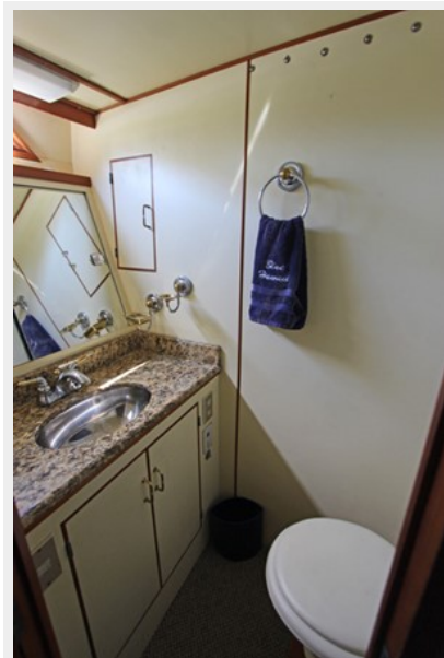
Master Head w/Electric Toilet & Granite Countertop