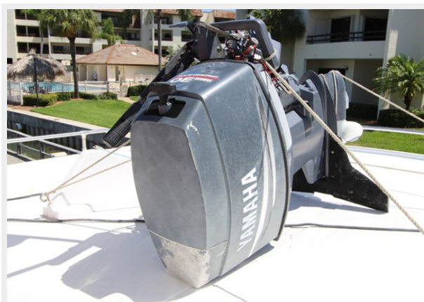
30 HP Yamaha Outboard