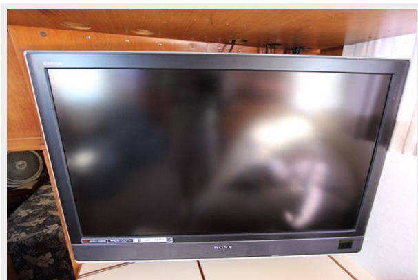
Sony 40" Flatscreen TV