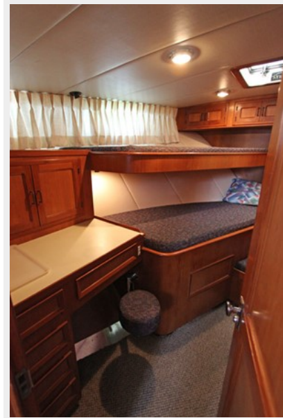
Forward Stateroom w/Vanity