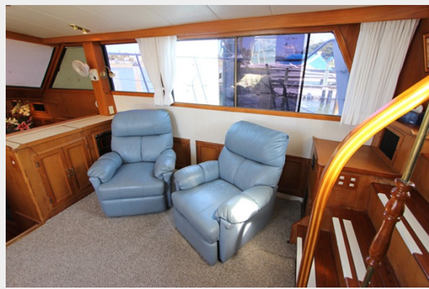
Salon To Starboard