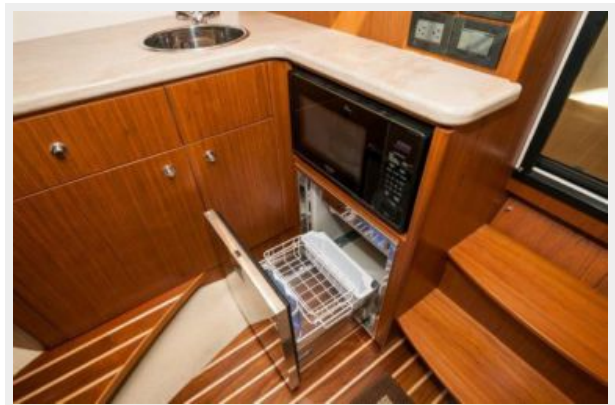
Microwave & Refrigerator