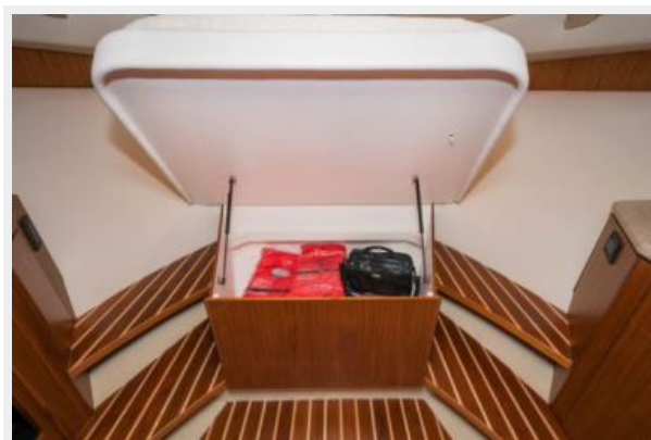
Under Berth Storage