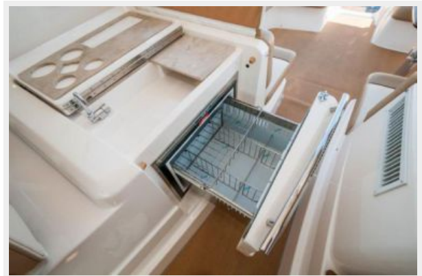
Cockpit Refrigerator & Wetbar