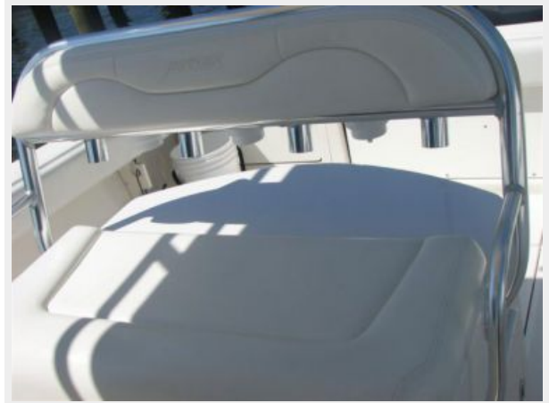
Deck 2 - Console Seating