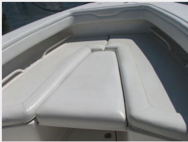
Deck 1 - Forward Seating With Filler