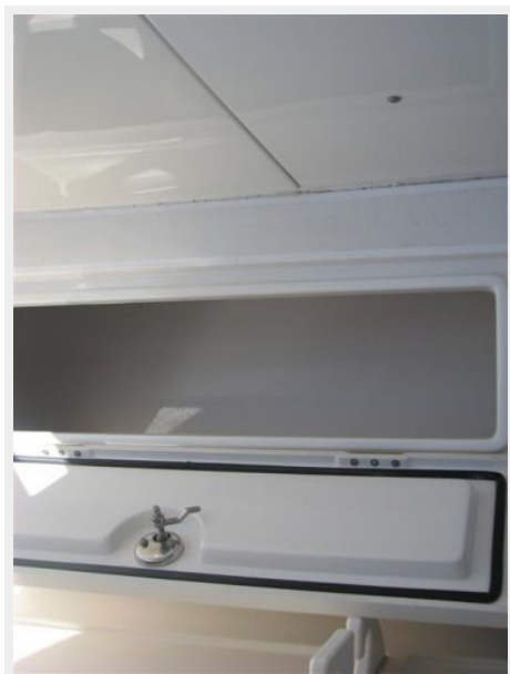
Deck 5 - In-Deck Rod Storage