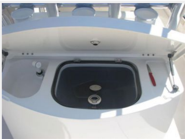
Cockpit / Fishing Equipment 2 - Live Well