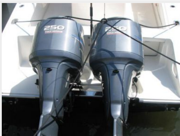
Engine & Mechanical Equipment 2 - Yamaha F-250's