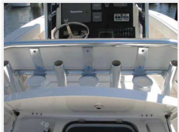
Cockpit / Fishing Equipment 1 - Leaning Post Rocket Launcher