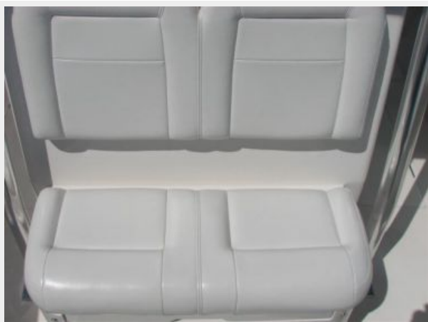
Deck 3 - Cooler Seat