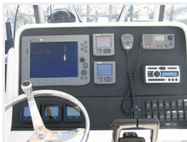
Center Console / Electronics & Navigation 3 Center Console / Electronics & Navigation 4 - Controls - Radar & Riggers