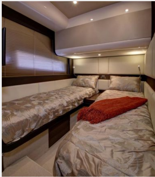
Guest Stateroom (2)