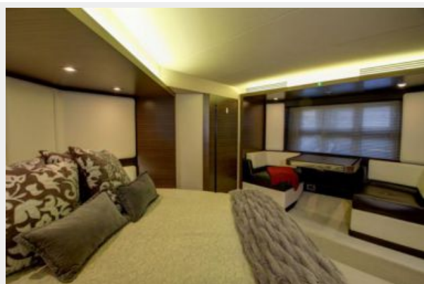
Master Stateroom to Port