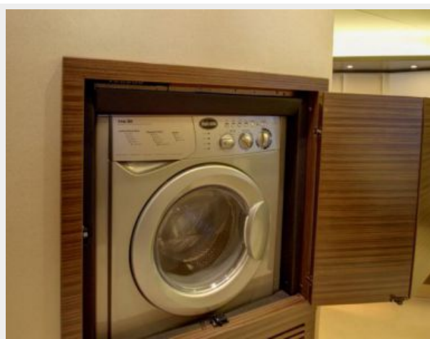
Washer/Dryer / Master Stateroom