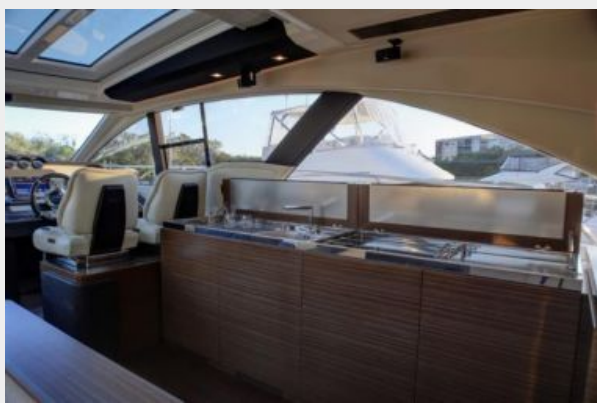
Galley w/ Drop Leaf in Up Position