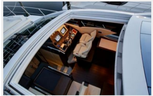
Electric Retractable Sunroof w/ Glass Panels