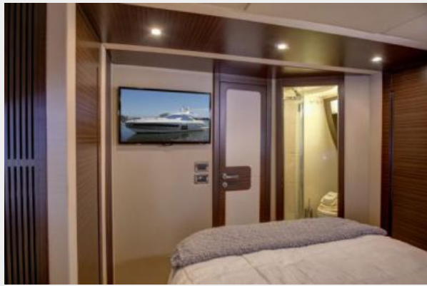
VIP Stateroom (2)