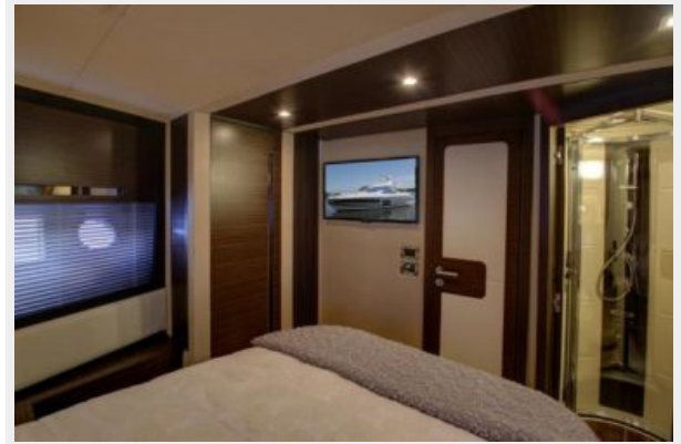
VIP Stateroom (3)