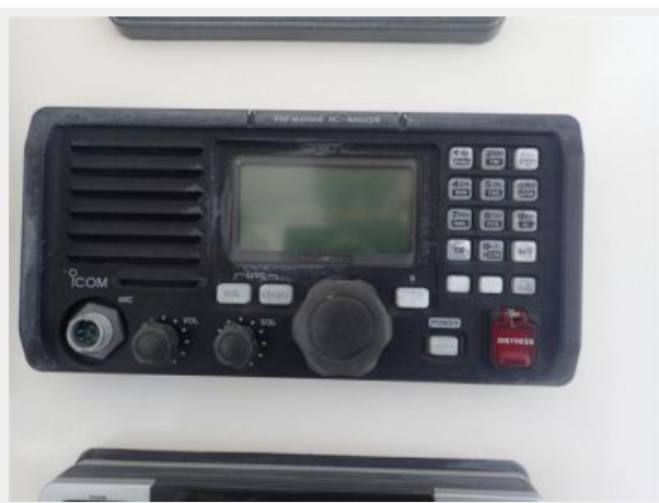
ICOM VHF Marine IC M604