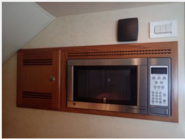
GE Turntable Microwave Oven