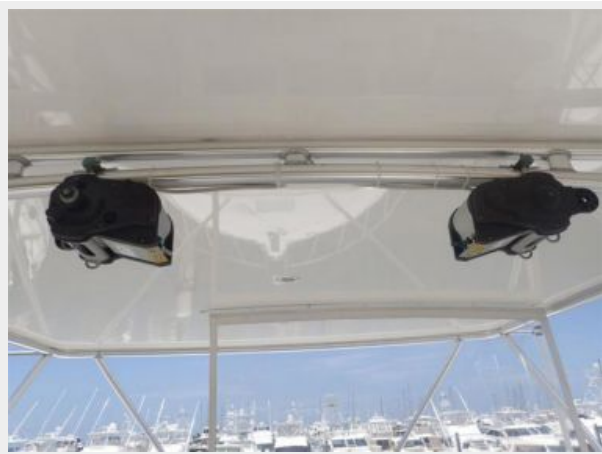
Electronic Reels for Outriggers