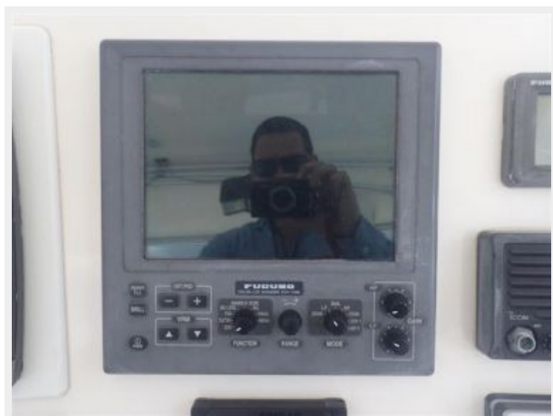
Furuno Color LCD Sounder