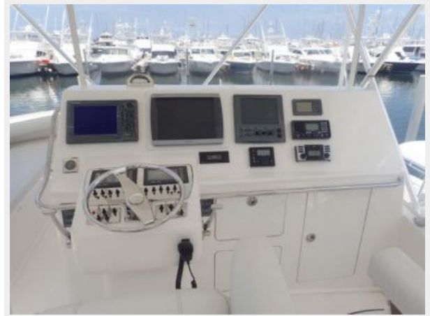
Flybridge Helm Electronics