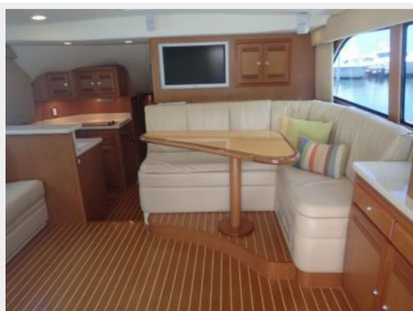
Main Salon Forward