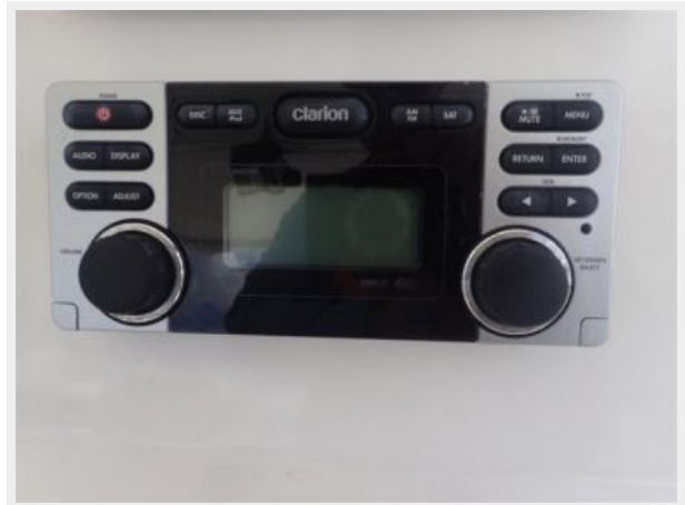
Clarion Stereo System