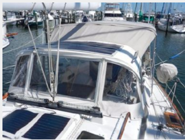
Wave stopper hard dodger