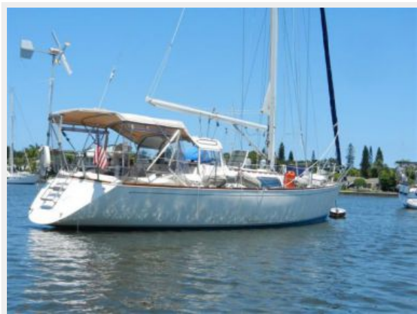
Starboard Stern quarter