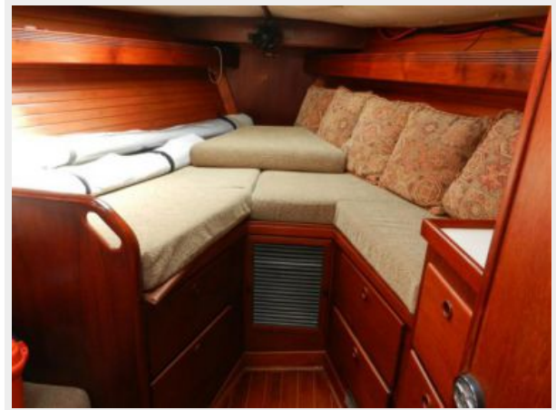
V berth with filler