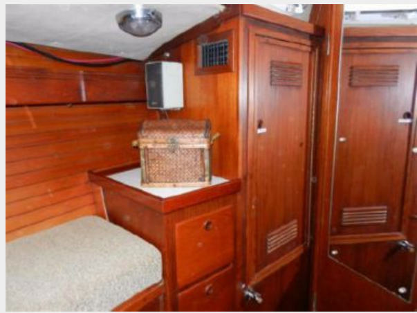
Aft cabin seat and lockers