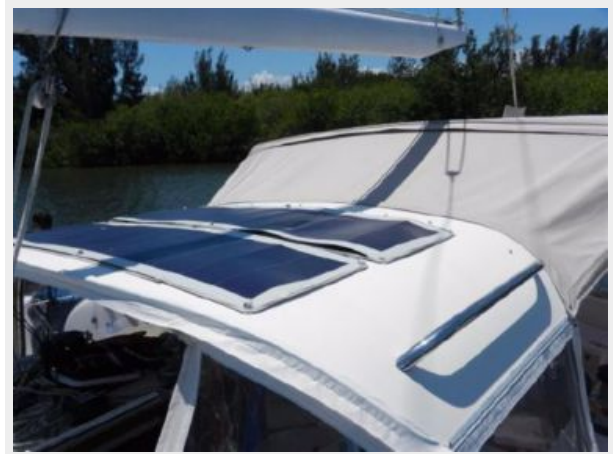
flexible solar panels