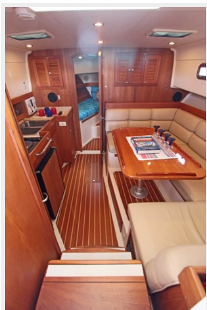
Entering the beautiful cabin with teak & holly sole