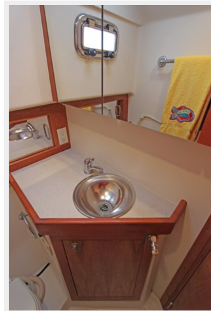
Head with stainless steel sink, vanity, storage