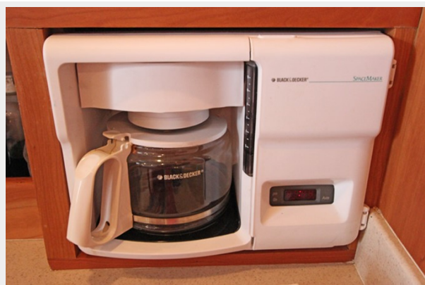
Black & Decker Spacemaker