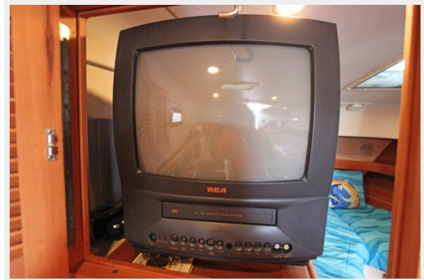
RCA TV/VCR that swivels from stateroom to dining area for viewing