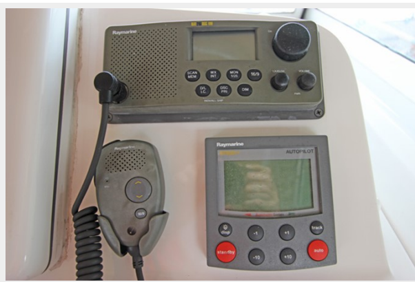
Raymarine 215DSC VHF, Raymarine ST6001+ AutoPilot