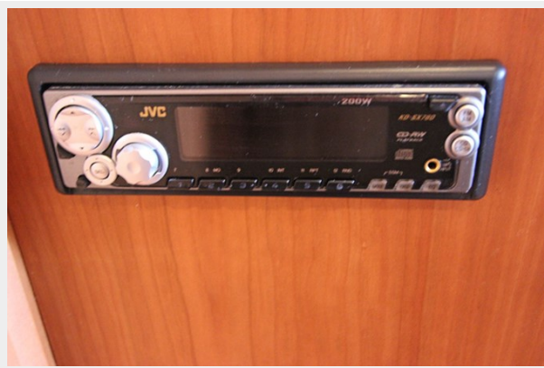
JVC Stereo w/CD