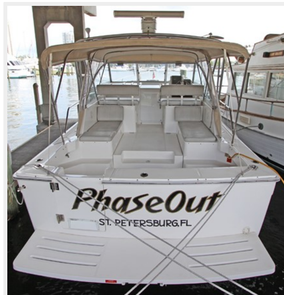
View of Stern and huge cockpit with extended swim platform