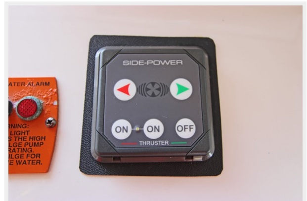
Side-Power Bow Thruster