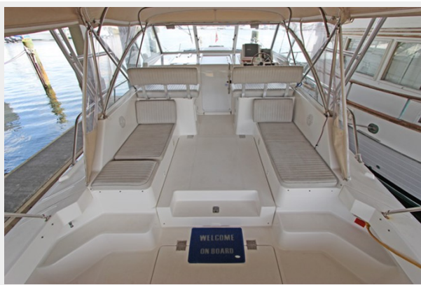
View of Cockpit forward