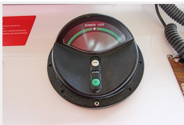
Azimuth 1000 Digital Compass