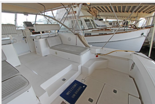
Starboard Cockpit Seating with storage below