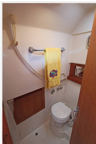
Head with electric toilet and shower head