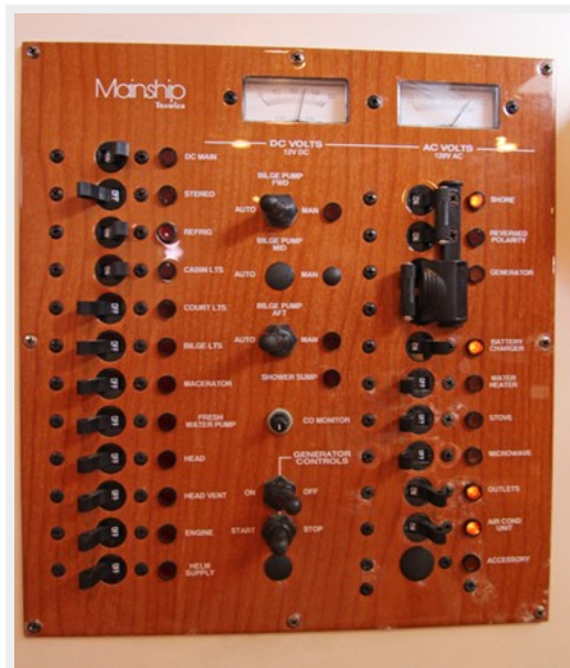
Electrical Panel just inside cabin area to starboard