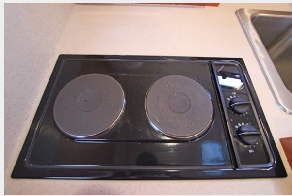
Princess 2-Burner Electric Stove Top