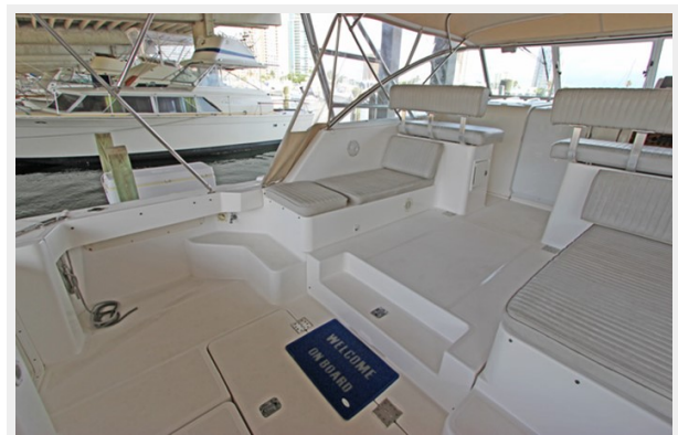
Port Cockpit with guest seating and storage below