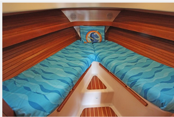
Forward Stateroom with queen berth with filler cushion