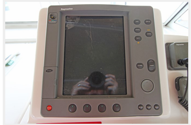
Raymarine RL80C Pathfinder Radar/Plotter