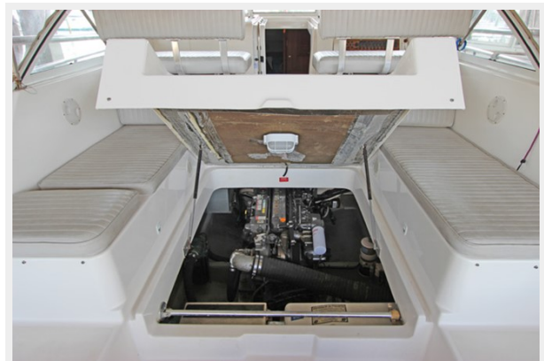
Electric lift to Engine Compartment