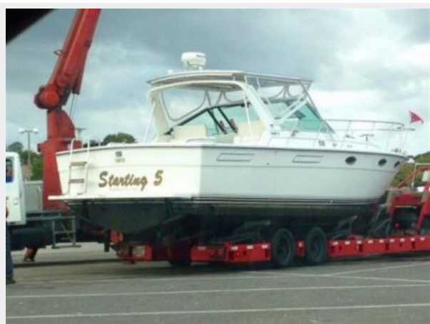
Hauling October 2014