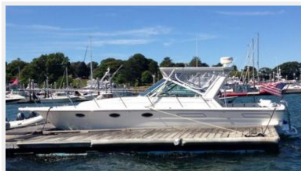
Port profile, September 2014