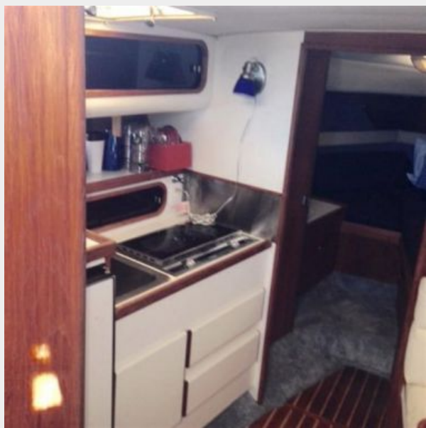
Looking forward from cabin entry (galley)