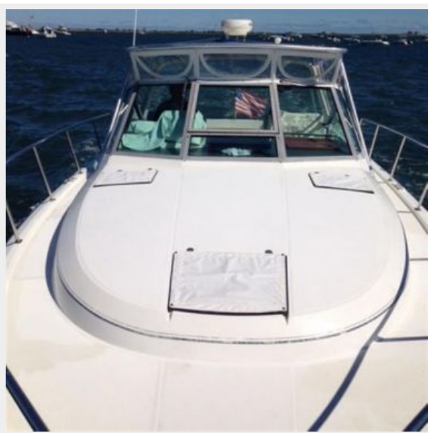
From the pulpit