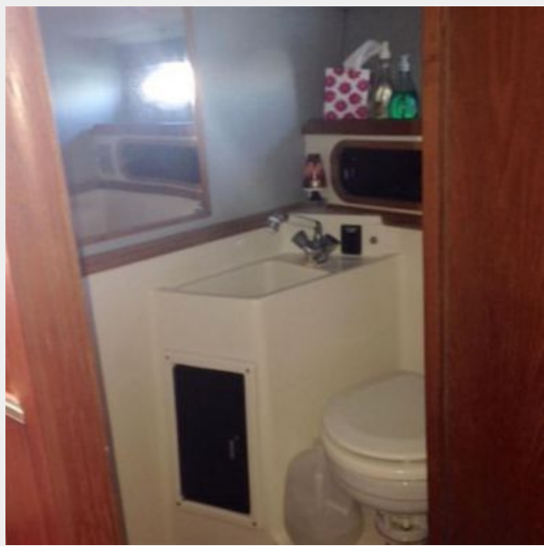
Large enclosed head with shower and ample storage