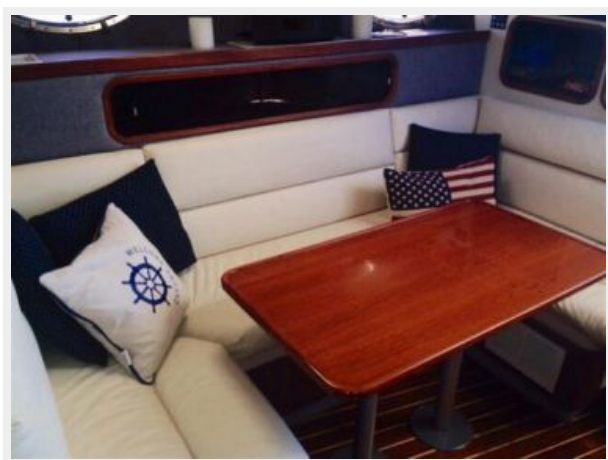
Settee and teak varnished table