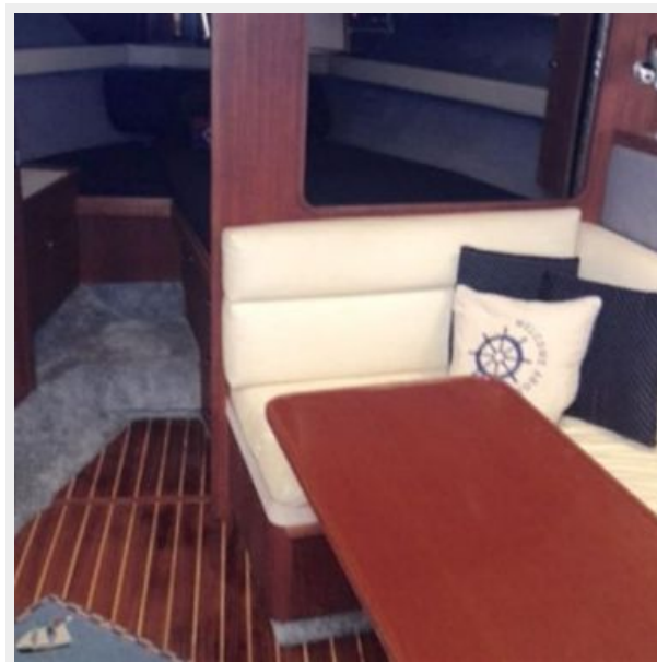
View aft from galley