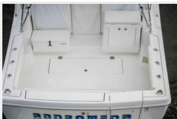
Fishbox to Port / Tackle Station to Starboard