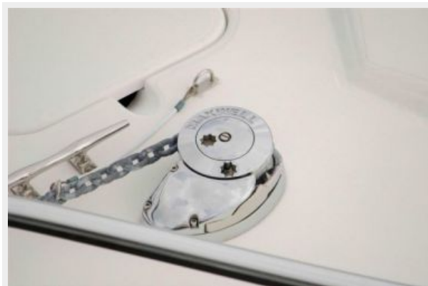
Windlass Chain / Rode