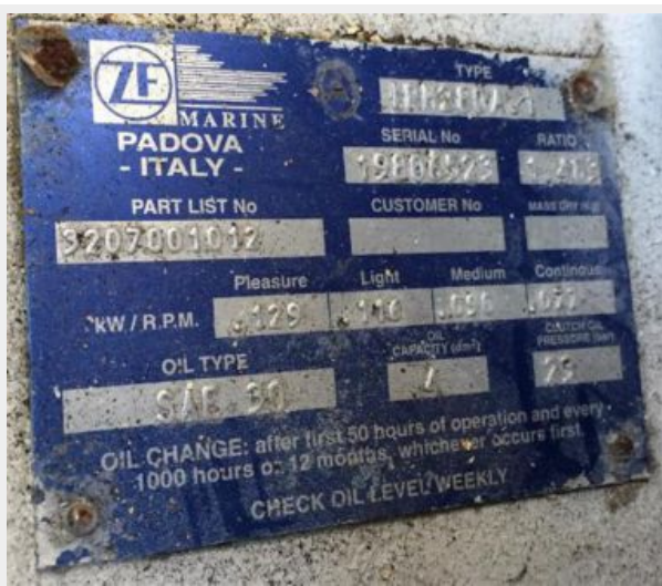
Port ZF Transmission