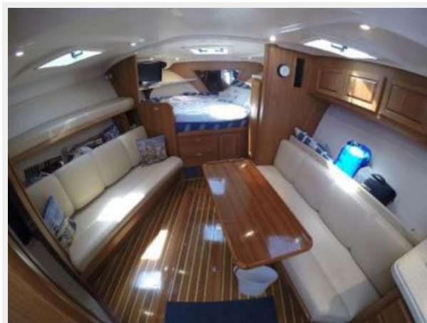
Cabin - Facing Forward