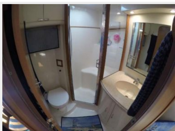
Head / Shower