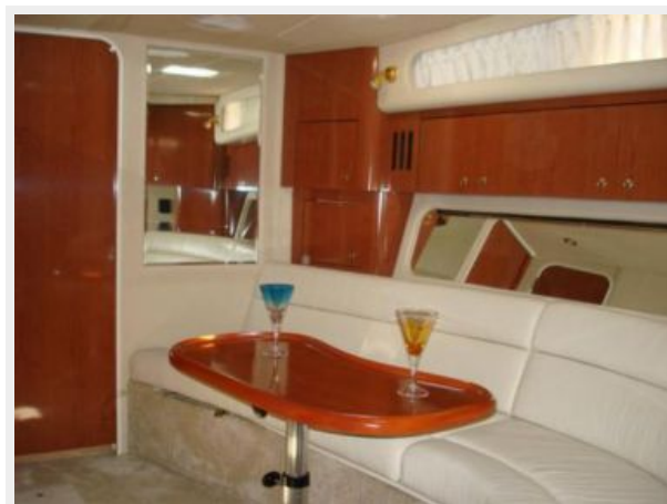
Salon Sofa and Cherrywood Table