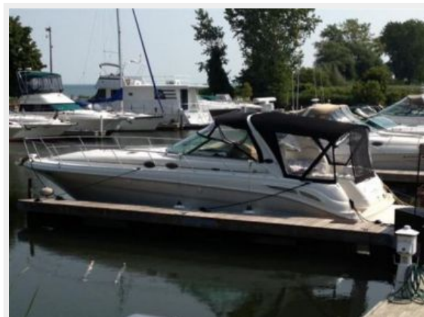
New Canvas enclosure