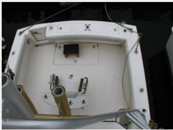
Cockpit / Fishing Equipment 1 - Cockpit