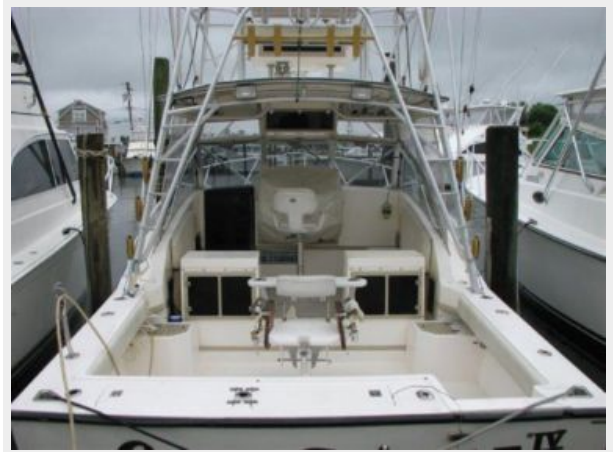
Cockpit / Fishing Equipment 2 - Cockpit