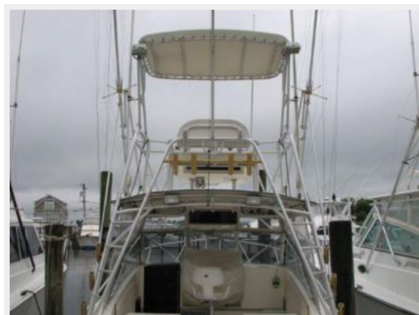
Deck 1 - Tower