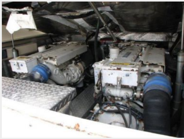
Engine & Mechanical Equipment - Engine Room