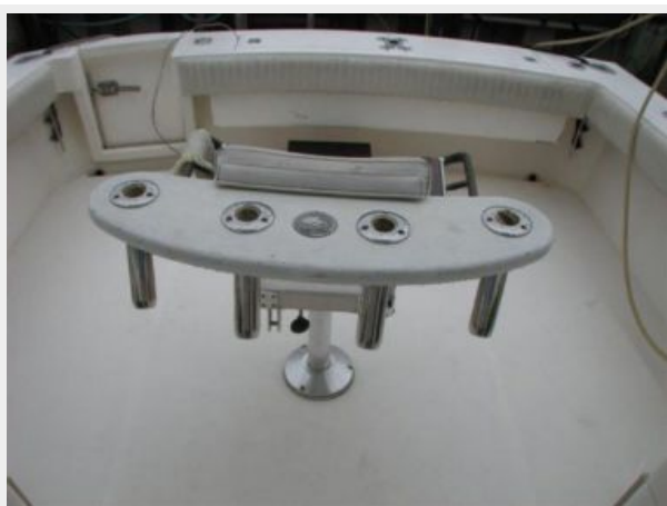
Cockpit / Fishing Equipment 3 - Rocket Launcher