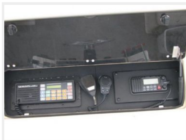
Helm / Electronics & Navigation 3 - Radio Box