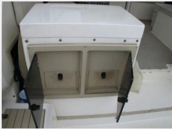
Cockpit / Fishing Equipment 5 - Tackle Storage