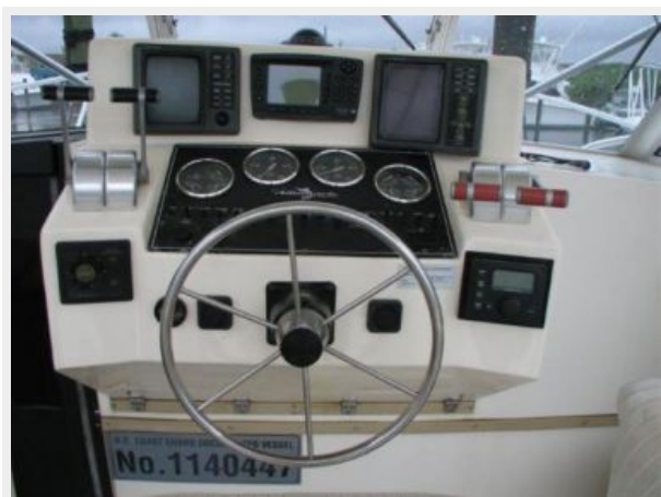
Helm / Electronics & Navigation 2