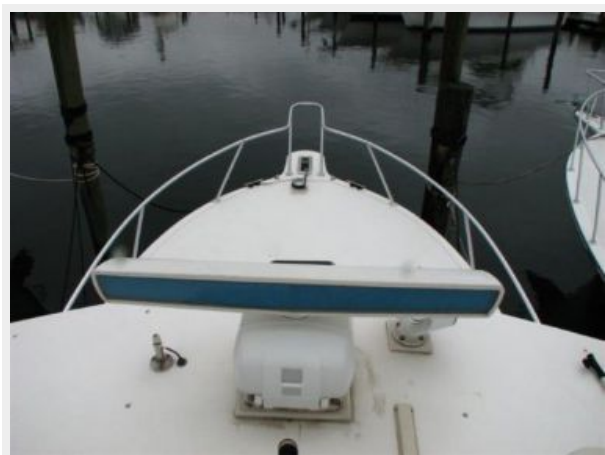
Deck 2 - Bow