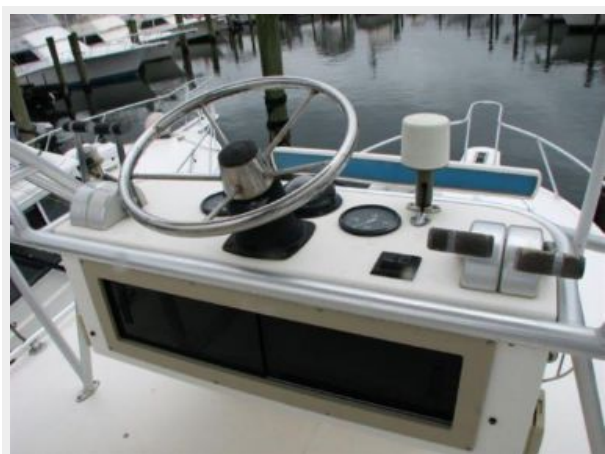
Helm / Electronics & Navigation 4 - Tower Controls