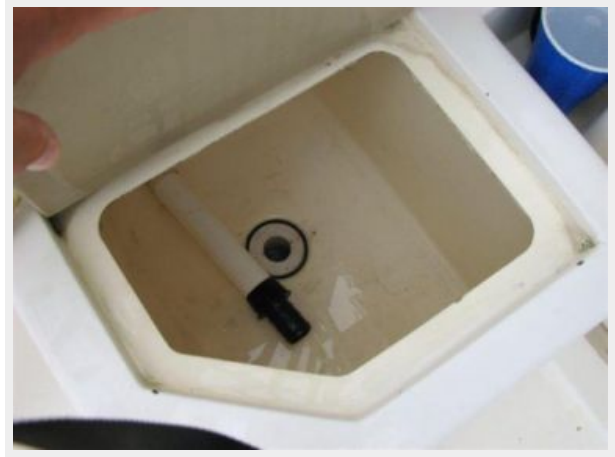
Cockpit / Fishing Equipment 6 - Live Well