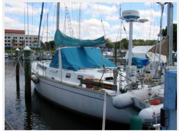
50' Gulfstar port aft profile