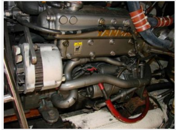
50' Gulfstar auxiliary