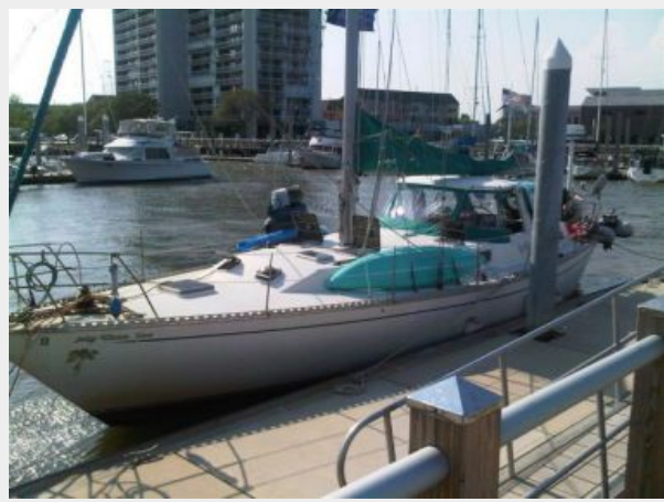
50' Gulfstar port forward profile