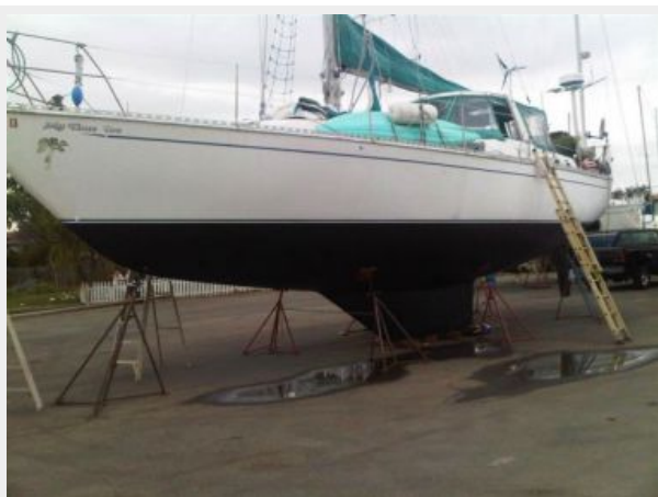
50' Gulfstar hauled out photo1