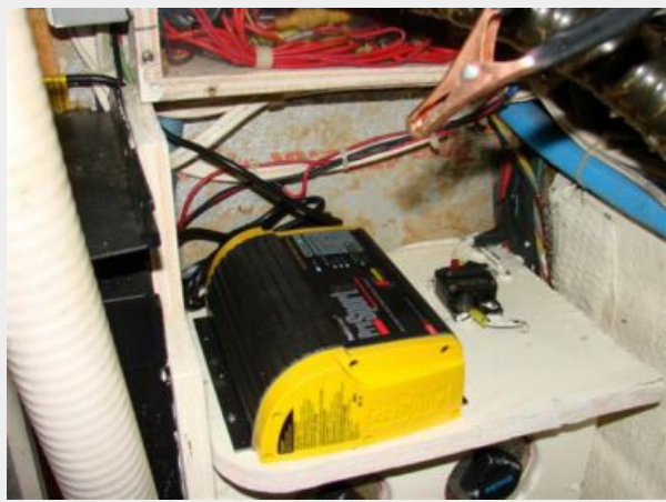
50' Gulfstar inverter