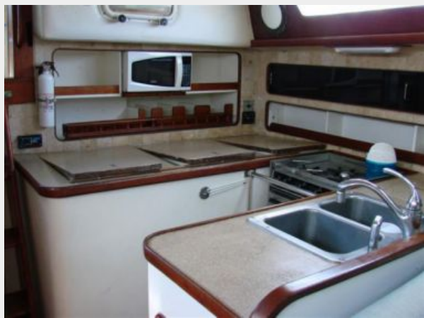
50' Gulfstar galley photo2