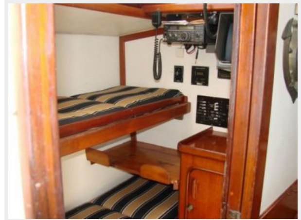
50' Gulfstar guest stateroom