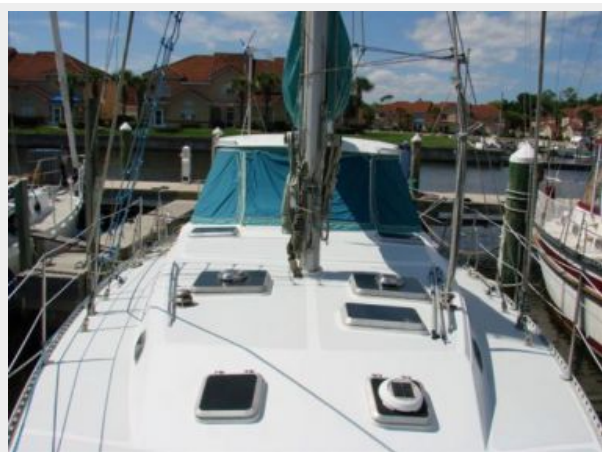
50' Gulfstar foredeck