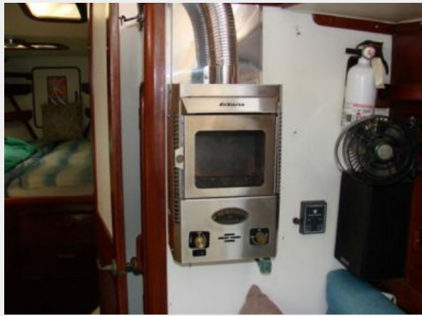
50' Gulfstar heating system