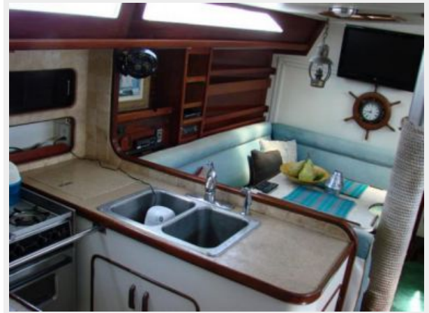
50' Gulfstar galley photo1