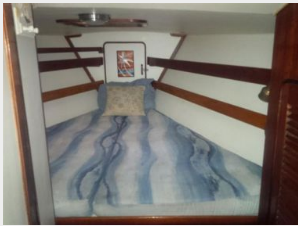
50' Gulfstar forward guest stateroom