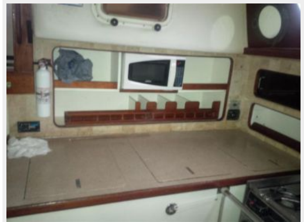
50' Gulfstar galley photo3