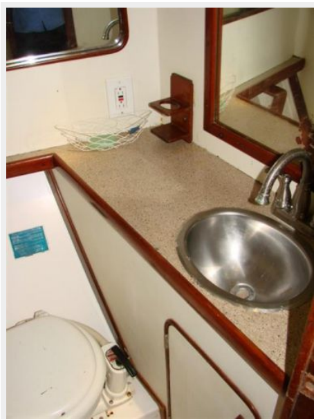
50' Gulfstar guest head