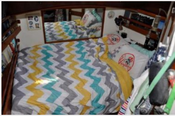
50' Gulfstar master stateroom