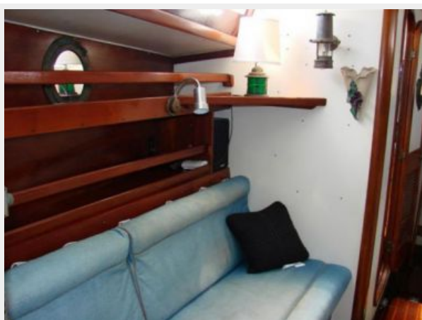
50' Gulfstar salon starboard seating aft