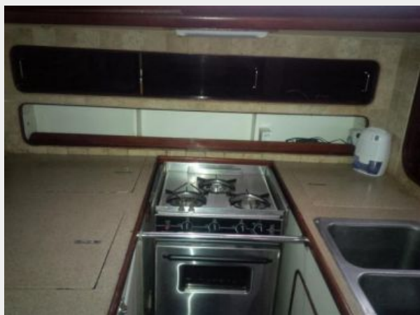
50' Gulfstar galley photo4