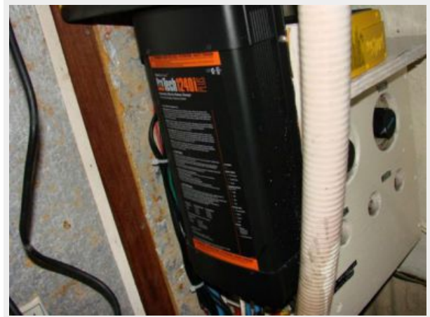
50' Gulfstar battery charger