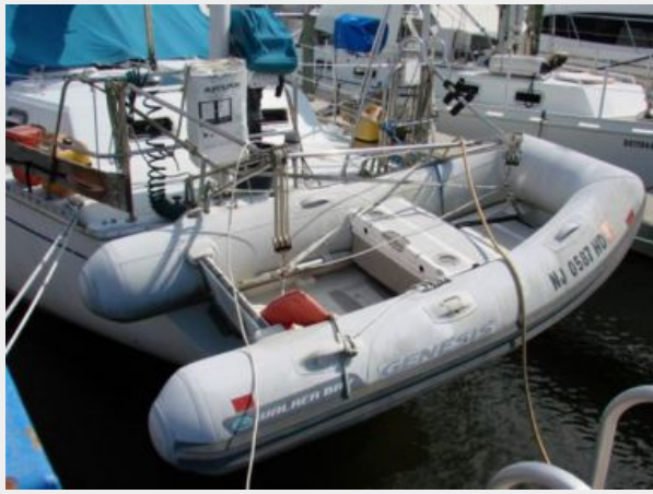
50' Gulfstar tender photo2