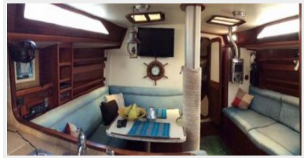
50' Gulfstar salon forward