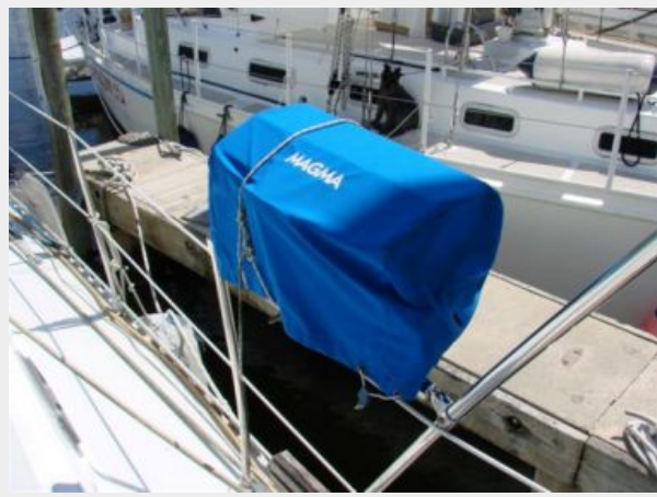
50' Gulfstar BBQ grill