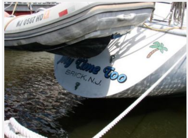
50' Gulfstar transom