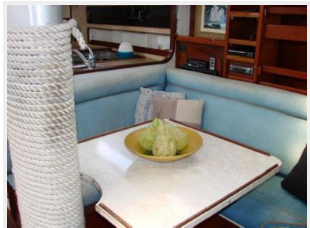
50' Gulfstar salon settee