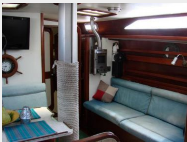
50' Gulfstar salon starboard seating forward