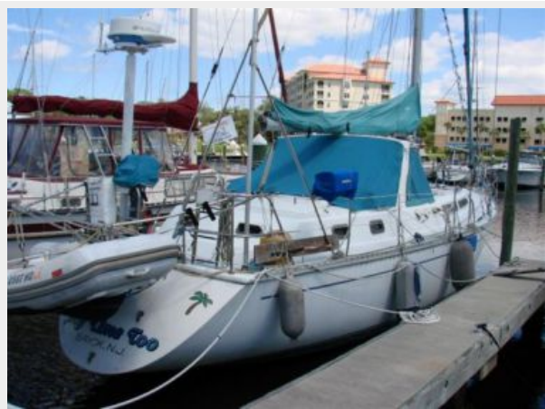
50' Gulfstar starboard aft profile