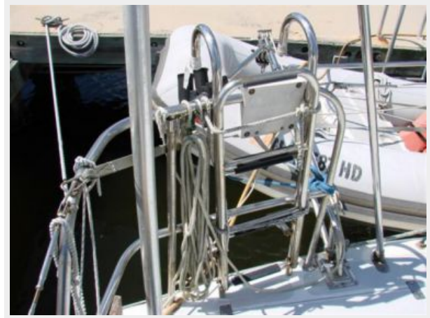
50' Gulfstar boarding ladder