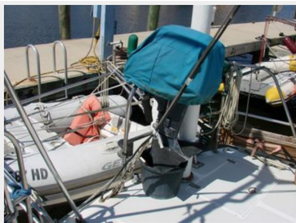
50' Gulfstar aftdeck