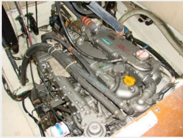
50' Gulfstar engine compartment