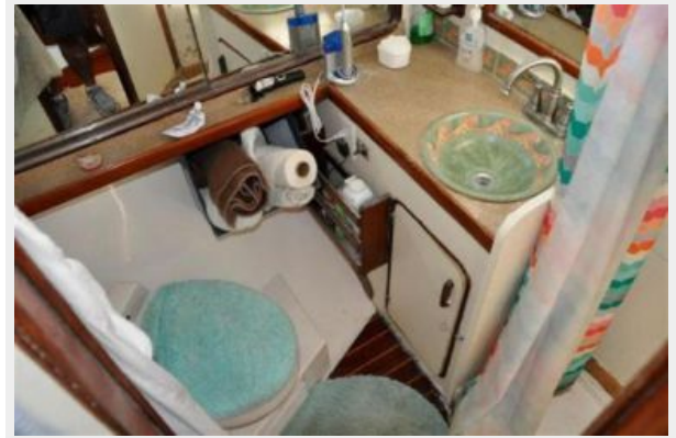
50' Gulfstar master stateroom head