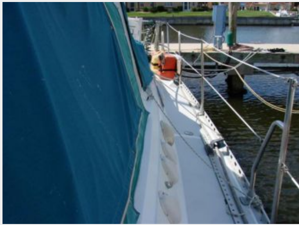
50' Gulfstar starboard side deck