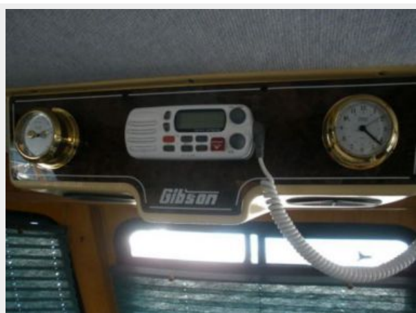
Lower Helm 2