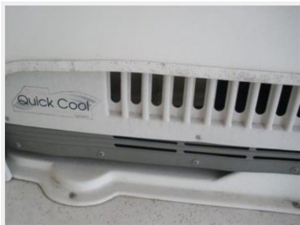
Reverse Cycle A/C