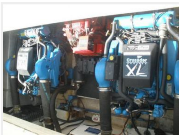
Twin FWC 454 Crusaders