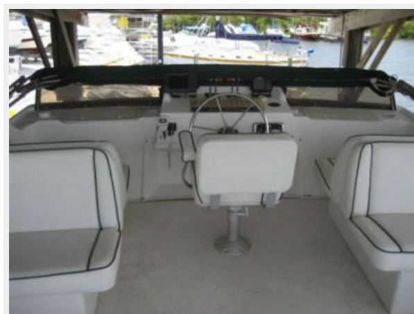
Bridge -Upper Helm