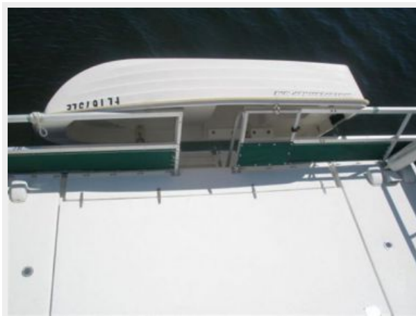
Aft Cockpit - 9' dinghy