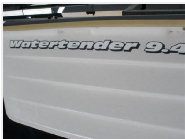
9' Leisure Water Tender