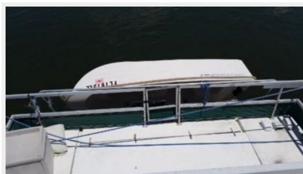
9' Tender on Weaver Davits