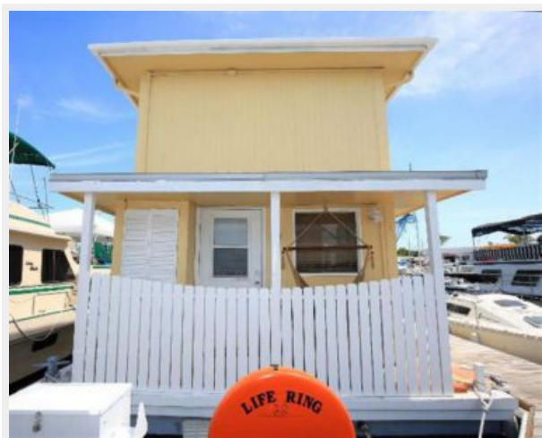
2 Story profile