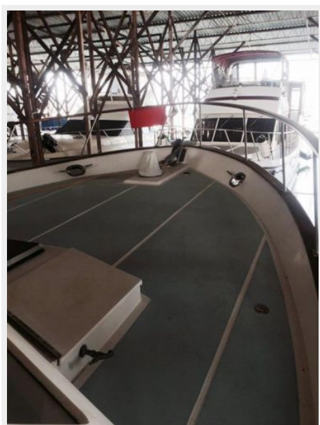
Transferrable Covered Moorage