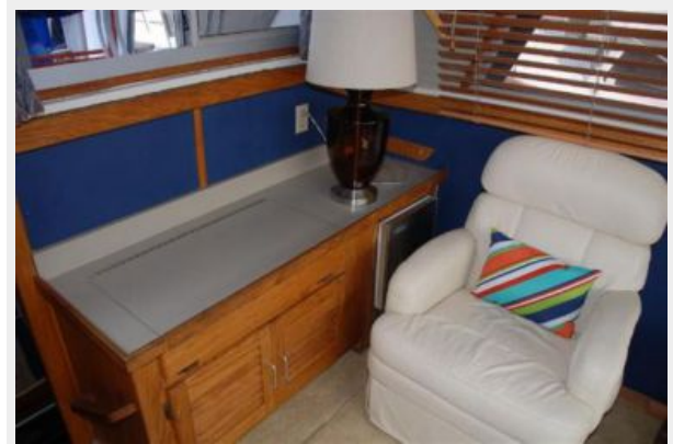
Wet Bar Closed