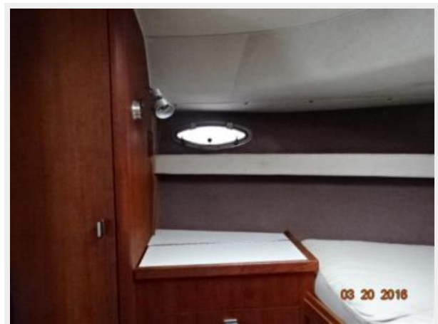
Tiara 31 Stateroom Port