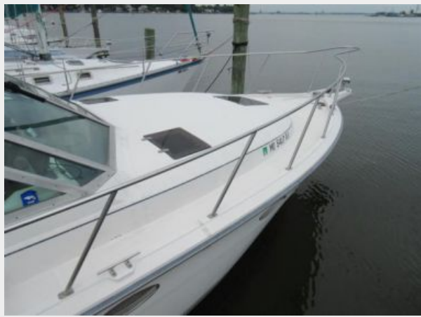
Tiara 31 Foredeck