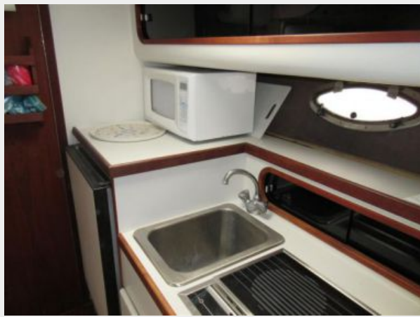
31' Tiara Galley