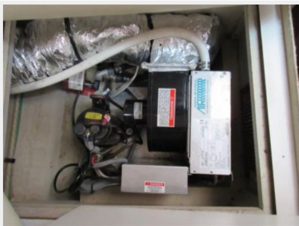
Tiara 31 Air Conditioning Unit