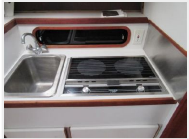
Tiara 31 Galley Photo3