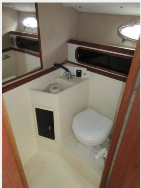
31' Tiara Head