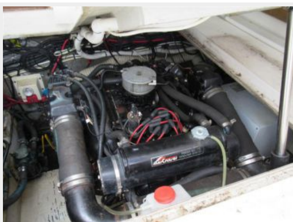
31' Tiara Starboard Main Engine