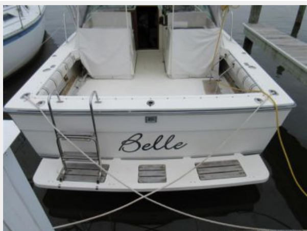
31' Tiara Cockpit