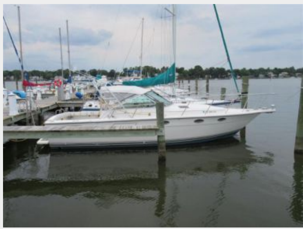
Tiara 31 Starboard Profile Previous Next