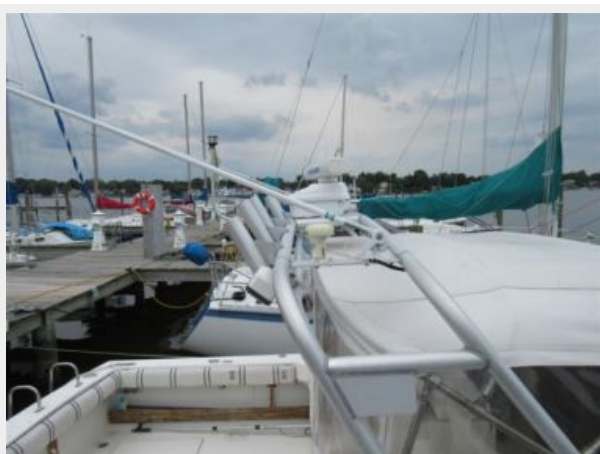
Tiara 31 Radar Arch