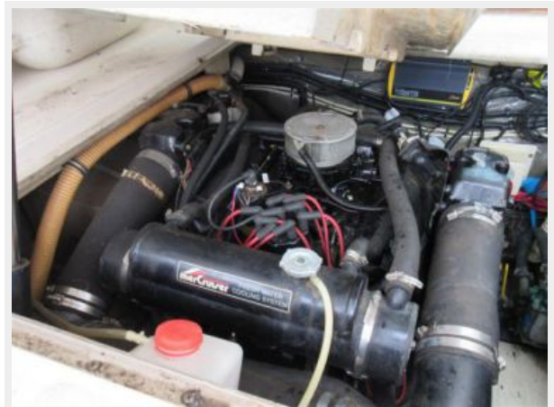
31' Tiara Port Main Engine