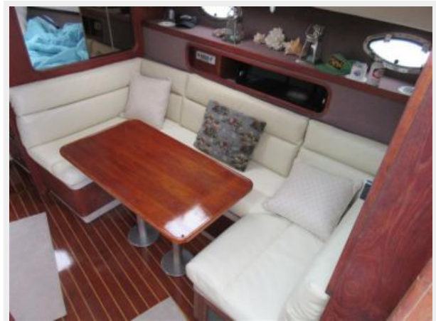
31' Tiara Salon