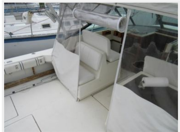
31' Tiara Cockpit Forward