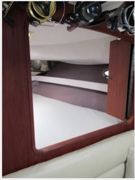
Tiara 31 Stateroom-Salon Window