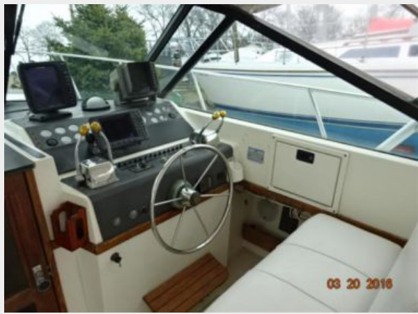
Tiara 31 Upper Deck Starboard