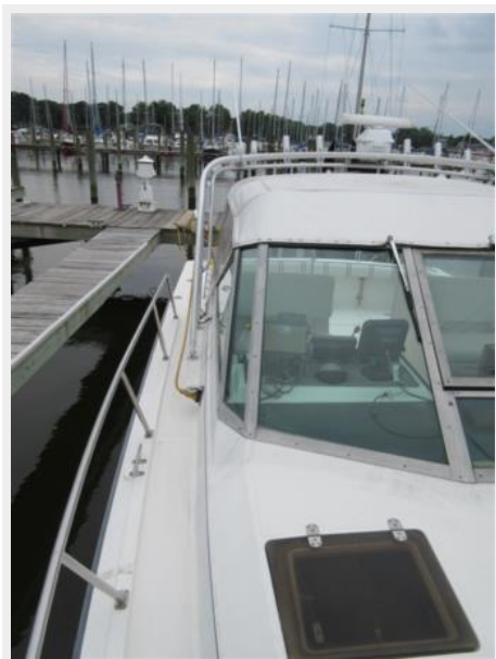
Tiara 31 Port Side Deck