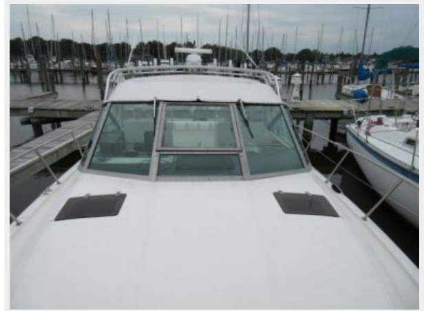
31' Tiara Foredeck Aft