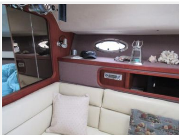
Tiara 31 Salon Starboard Forward