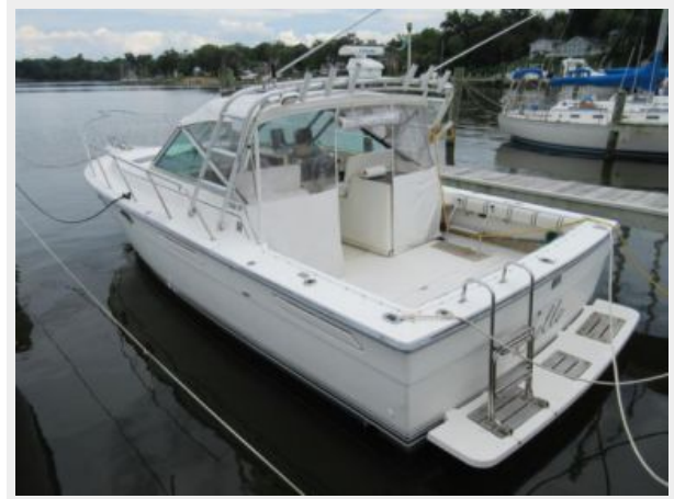
31' Tiara Port Aft Profile