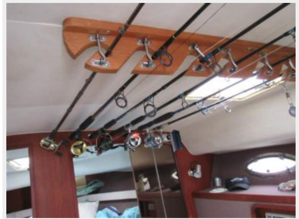
Tiara 31 Overhead Rod Storage