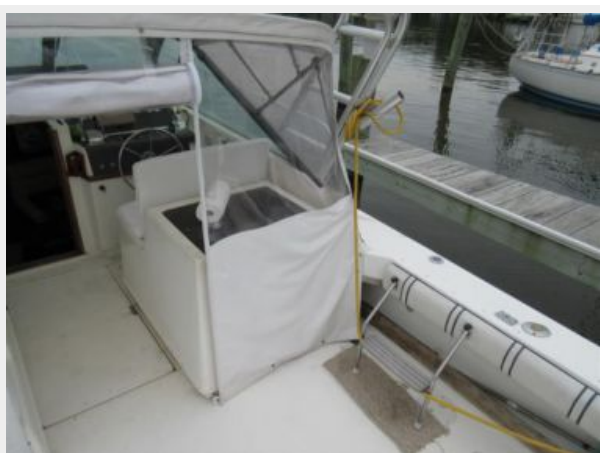
Tiara 31 Cockpit Starboard Forward