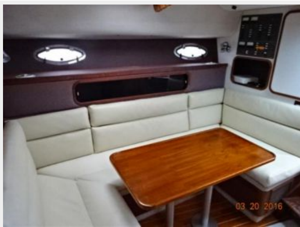
Tiara 31 Salon Starboard Photo1