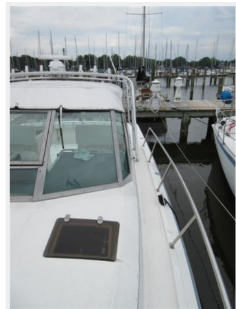
Tiara 31 Starboard Side Deck