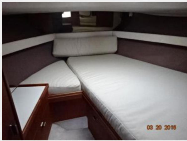
Tiara 31 Stateroom