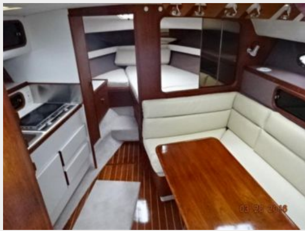
Tiara 31 Salon Forward