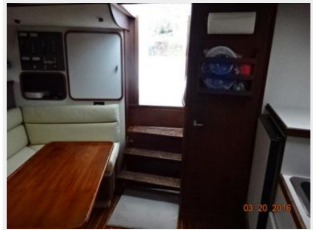
Tiara 31 Salon Aft