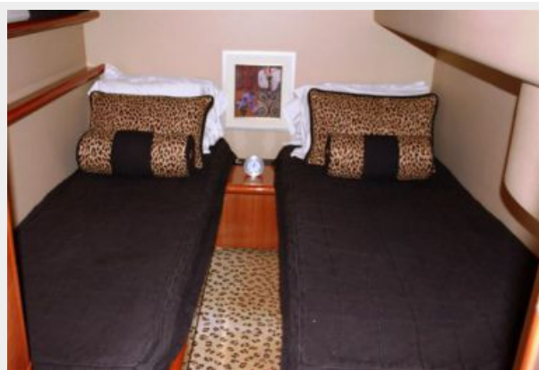
Guest Twin Stateroom 1