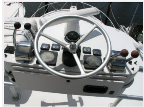
Helm / Electronics & Navigation 3 - Tower Helm