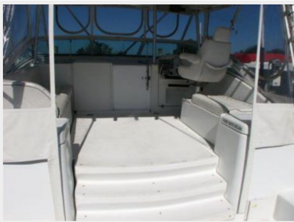
Deck 5 - Helm Deck