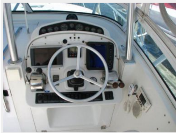
Helm / Electronics & Navigation 2