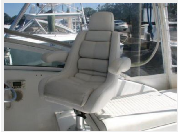
Deck 6 - Helm Seat