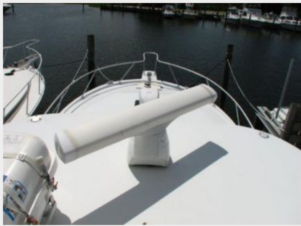
Deck 3 - View Forward From Tower