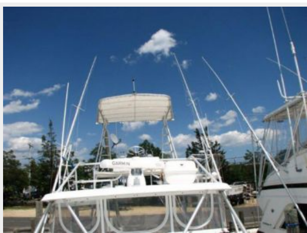
Deck 1 - Tower