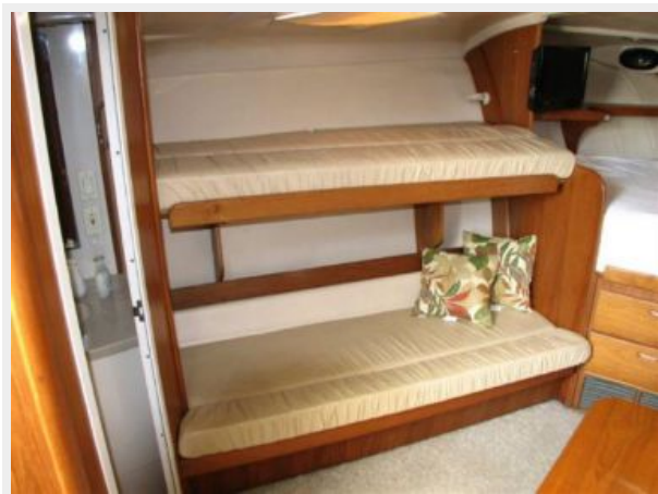
Main Cabin 3 - Fold-Down Upper & Lower Berths