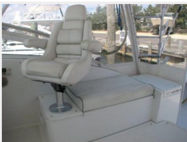
Deck 7 - Starboard Seating