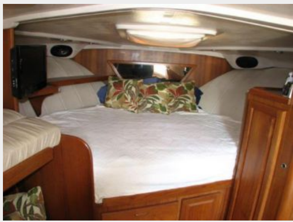
Main Cabin 1 - Forward Berth