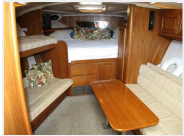
Main Cabin 2