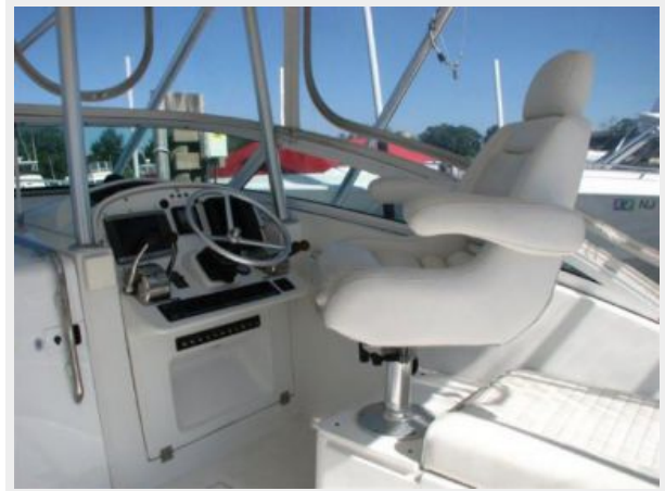
Helm / Electronics & Navigation 1