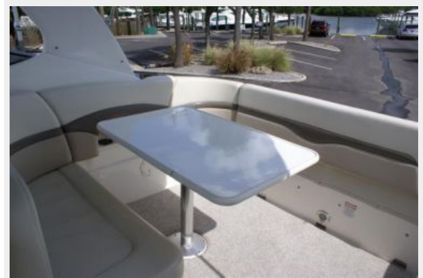
Fold Down Bench Seating