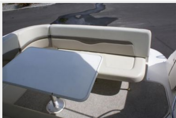
Seating Looking Aft