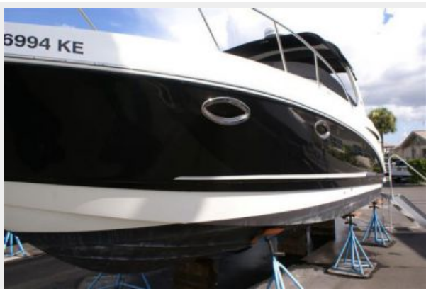
Starboard Side Looking Aft