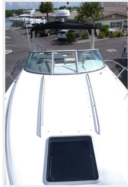
Bow and Radar Arch