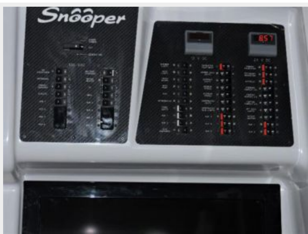
A/C + DC Panel