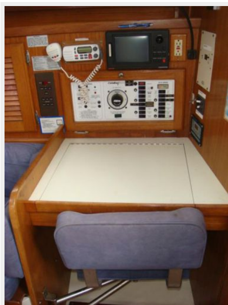
36' Catalina Nav Station