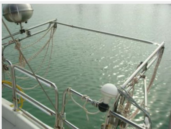
36' Catalina Tender Davits