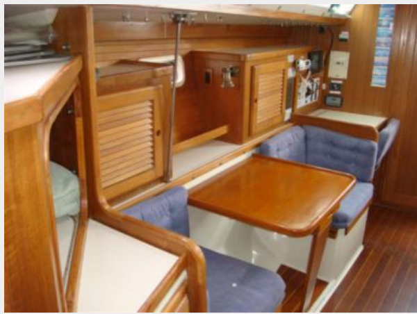
36' Catalina Salon Starboard Photo2