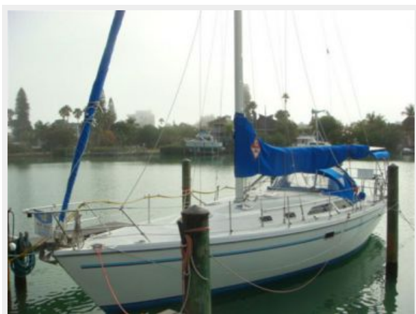
36' Catalina Port Forward Profile