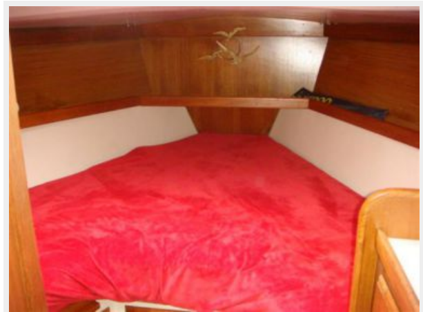
36' Catalina Guest Stateroom