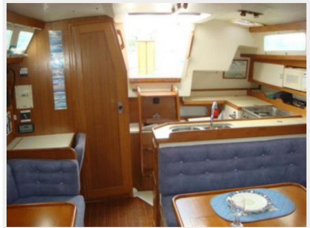
36' Catalina Salon Aft