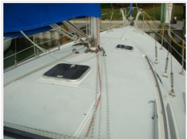
36' Catalina Foredeck