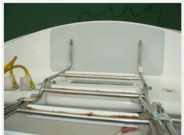
36' Catalina Swim Platform