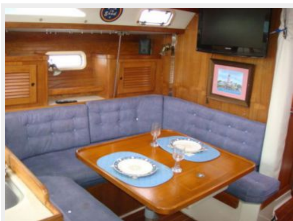
36' Catalina Salon Settee Photo2