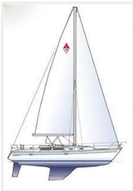
36' Catalina Sail Plan