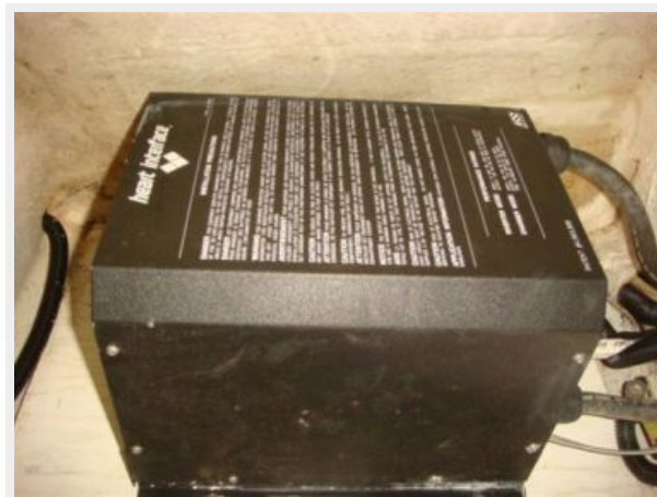
36' Catalina Inverter