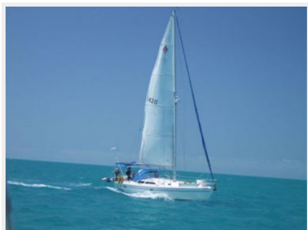
36' Catalina Underway