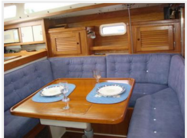
36' Catalina Salon Settee Photo1