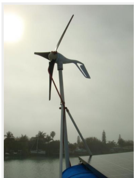
36' Catalina Wind Generator