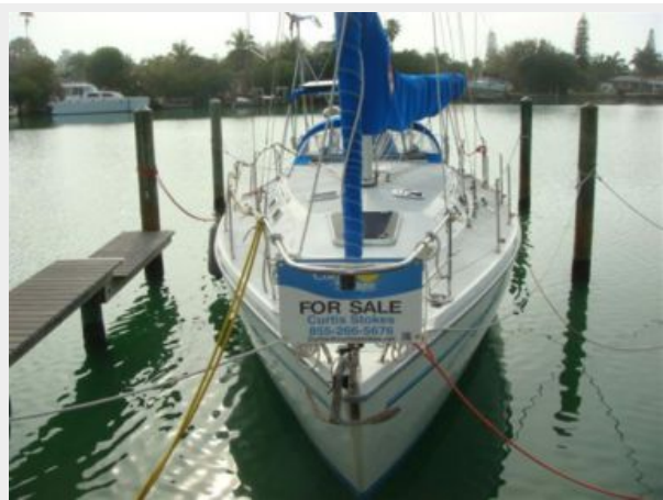
36' Catalina Forward Profile