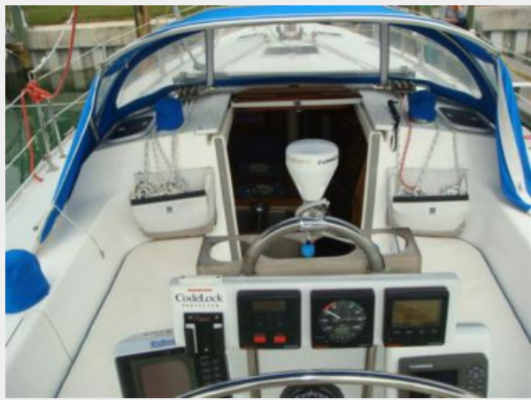
36' Catalina Cockpit Forward