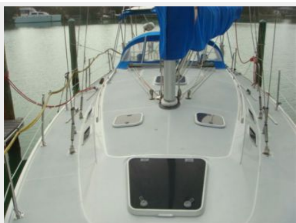
36' Catalina Foredeck Aft