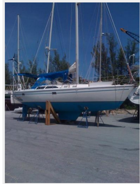
36' Catalina Hauled Out