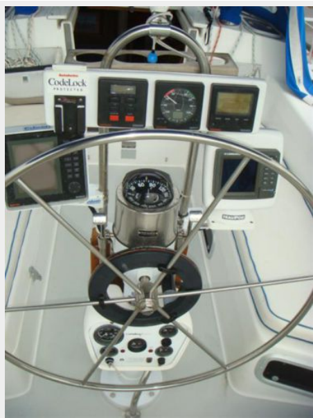
36' Catalina Cockpit Nav Pedestal