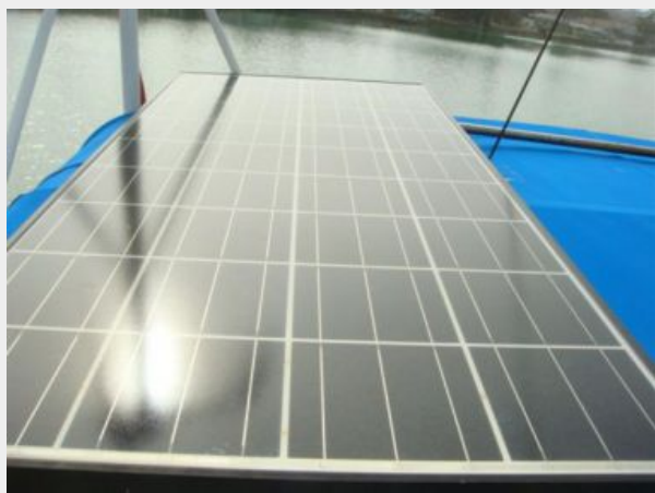
36' Catalina Starboard Solar Panel