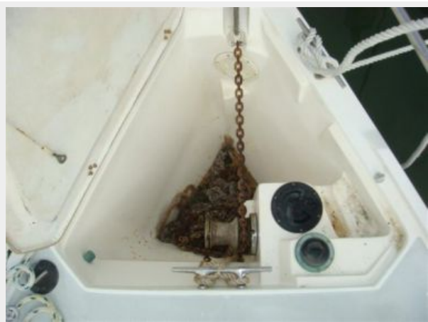
36' Catalina Anchor Windlass