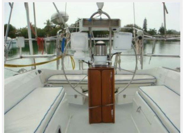
36' Catalina Cockpit Aft