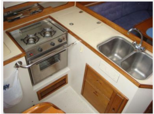
36' Catalina Galley Photo1