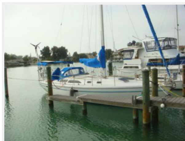
36' Catalina Starboard Forward Profile