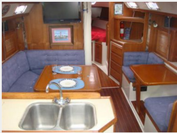
36' Catalina Salon Forward