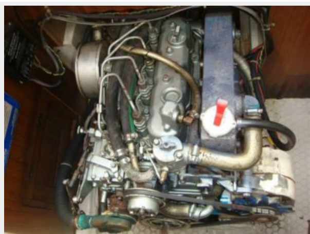
36' Catalina Auxillary