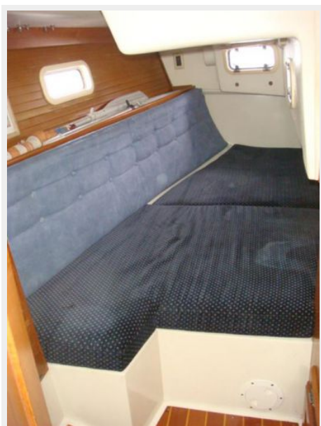
36' Catalina Master Stateroom