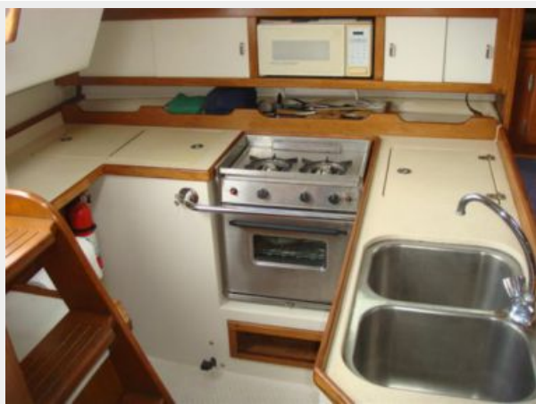
36' Catalina Galley Photo2