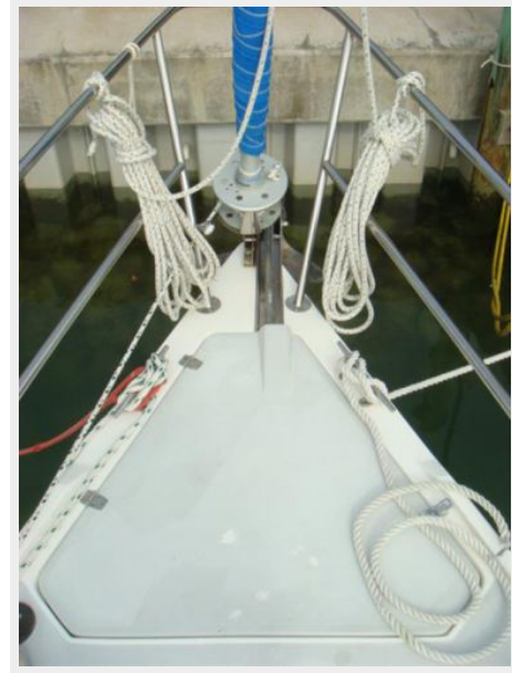
36' Catalina Anchor Windlass Covered