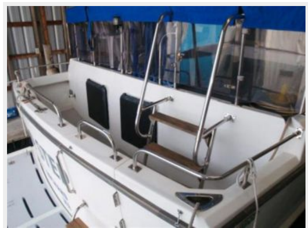
Aft Cockpit Starboard