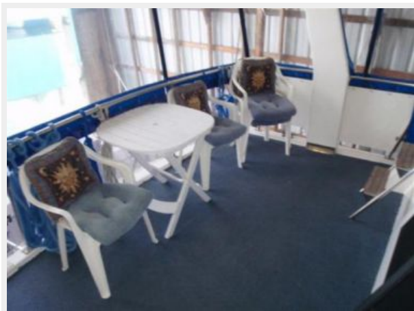
Enclosed Aft Deck