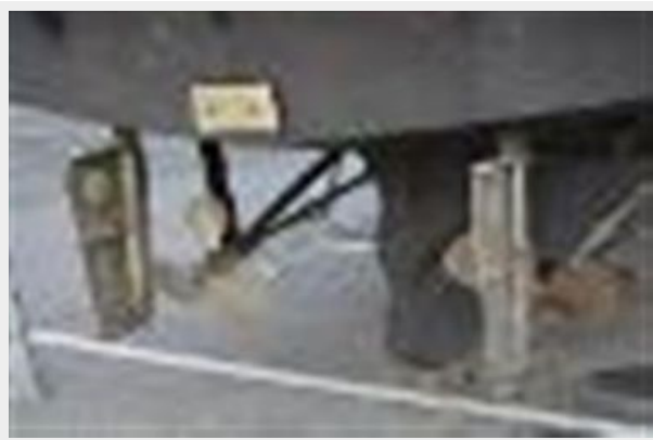
Props & rudders