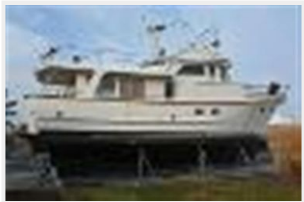
Hauled & Blocked Dec. 2014