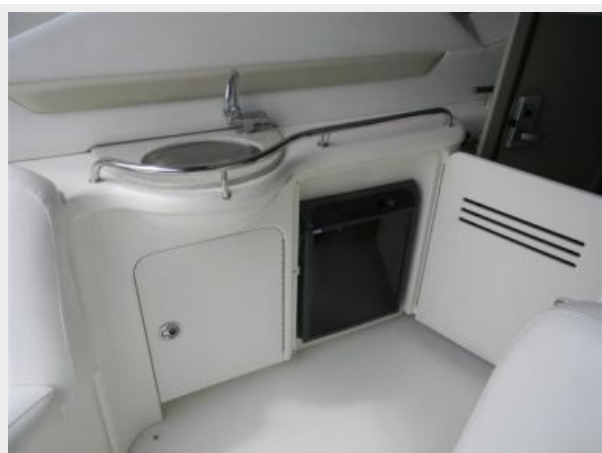
Cockpit Wetbar & Refrigerator