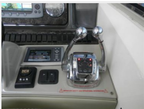
Helm Controls & Electronics