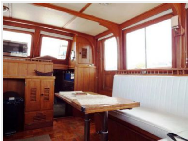
Salon Looking Aft