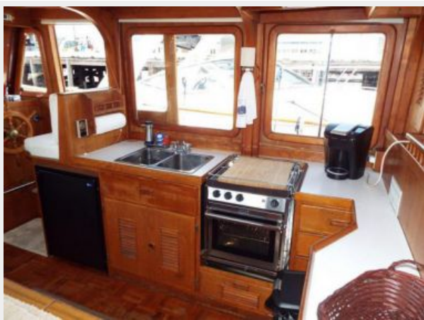
Galley Looking Forward