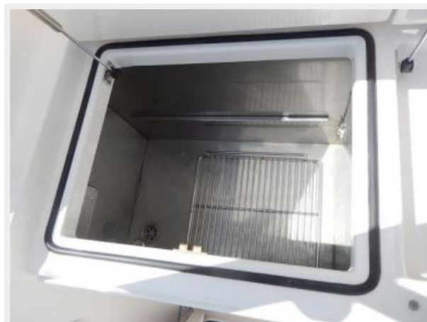
CP Bait freezer