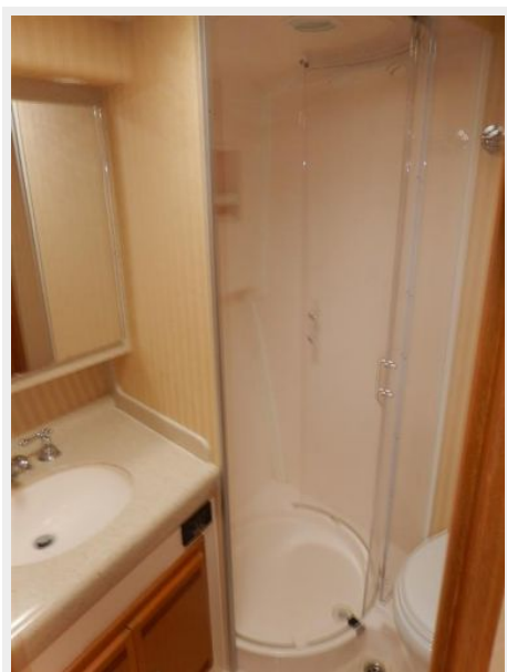
Head & SHower