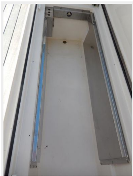
CP Freezer fish box