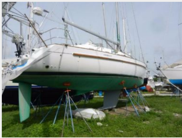
In yard storage