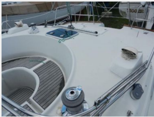
Center cockpit and aft deck