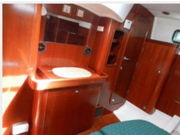
Aft cabin view 2