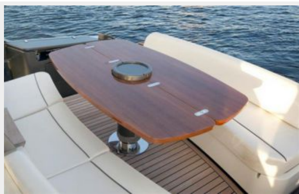
Aft Deck Table