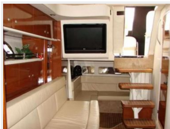
Aft Jump seat