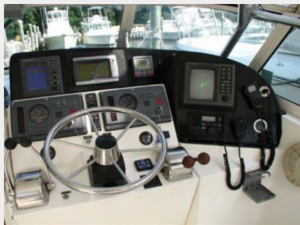
Helm / Electronics & Navigation 2