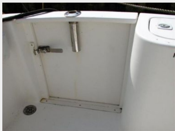
Cockpit / Fishing Equipment 4 - Tuna Door