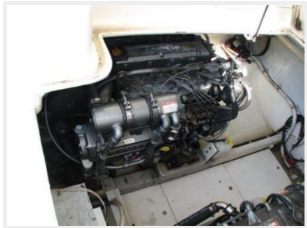
Engine & Mechanical Equipment 2 - Port Engine