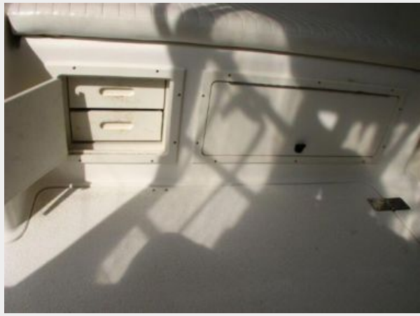
Deck 5 - Helm Storage