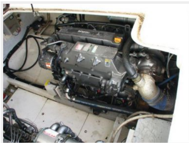
Engine & Mechanical Equipment 3 - Starboard