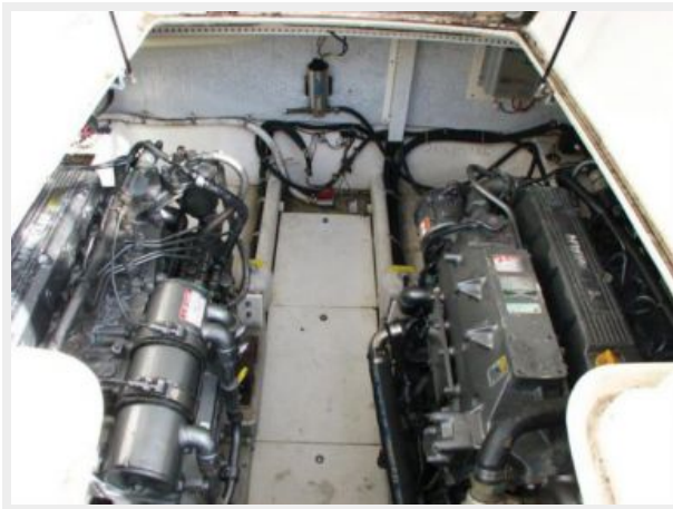
Engine & Mechanical Equipment 1 - Engine Room