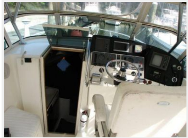
Helm / Electronics & Navigation 1