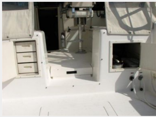
Cockpit / Fishing Equipment 2 - Cockpit Storage