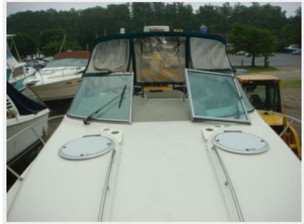
32' Maxum Foredeck Aft