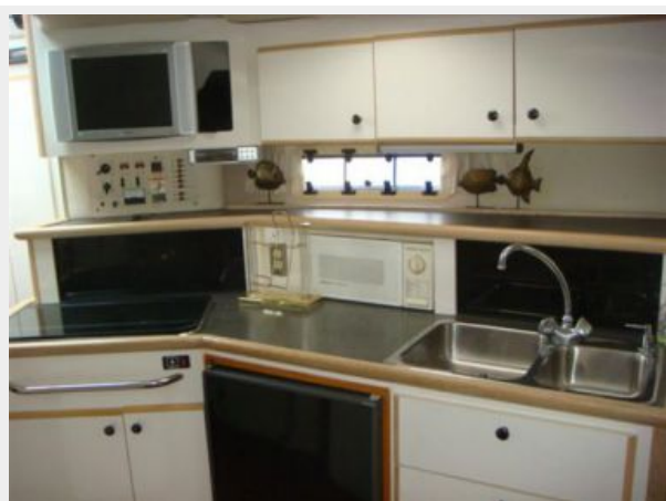
32' Maxum Galley Photo2