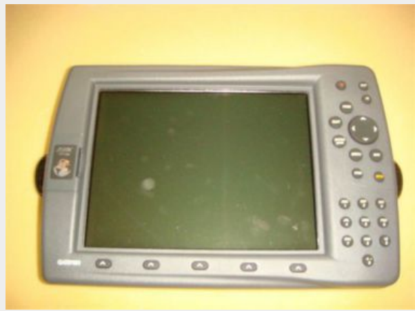
32' Maxum Helm Chartplotter