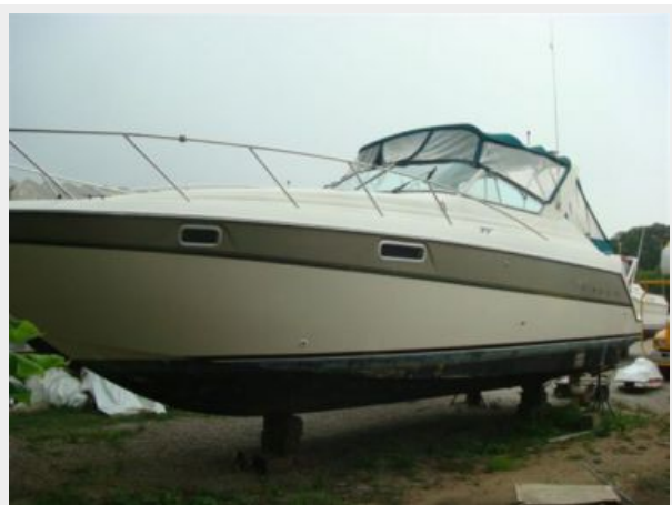
32' Maxum Port Forward Profile