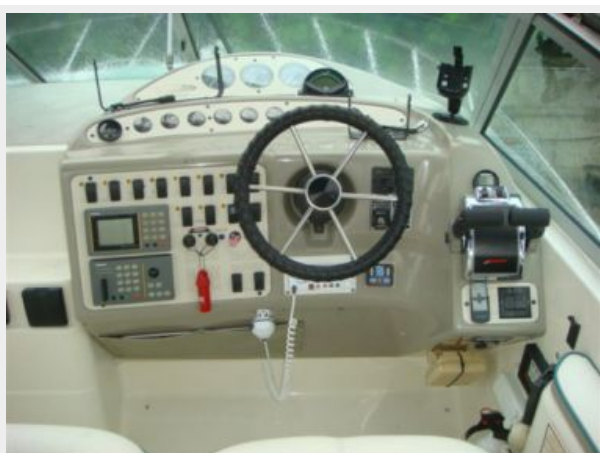
32' Maxum Helm Photo2