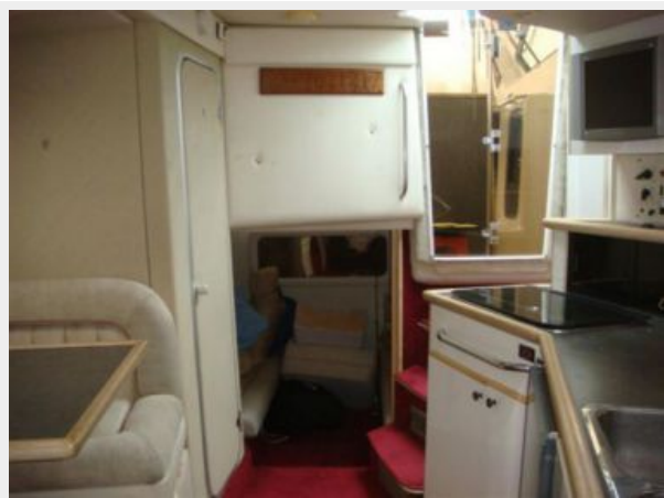
32' Maxum Lower Deck Aft