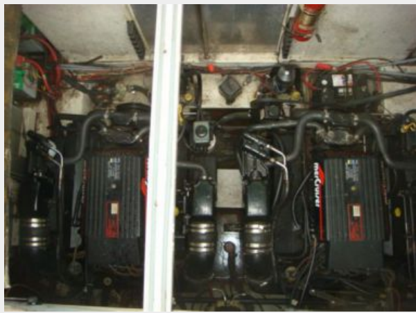
32' Maxum Engine Room