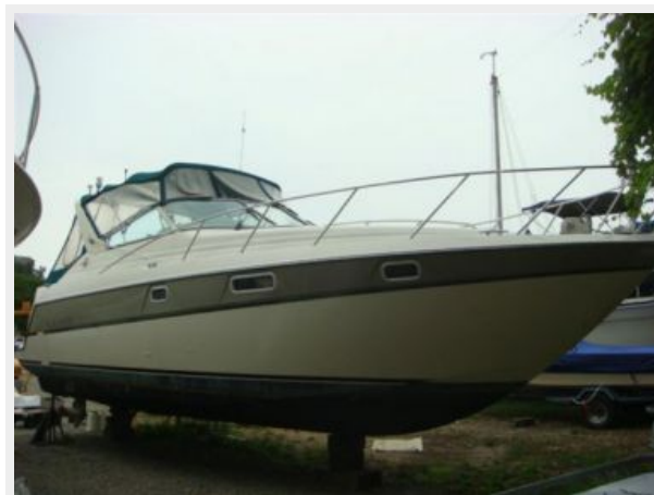
32' Maxum Starboard Forward Profile