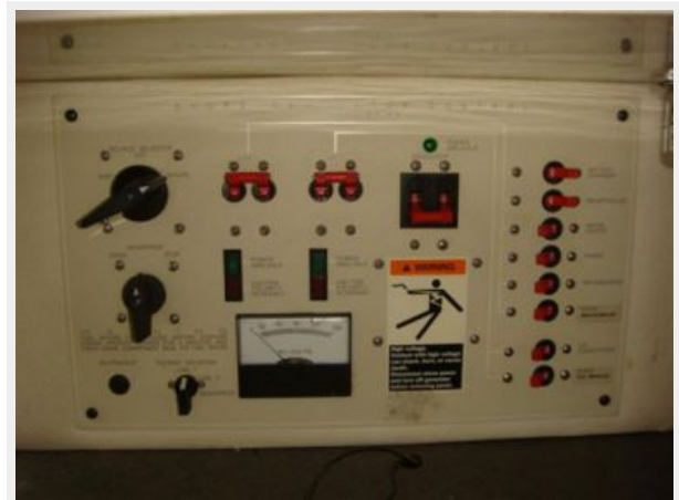
32' Maxum Electrical Panel