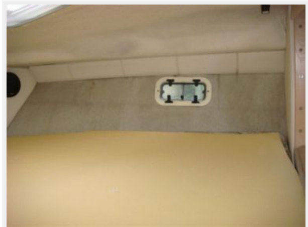
32' Maxum Master Stateroom Starboard