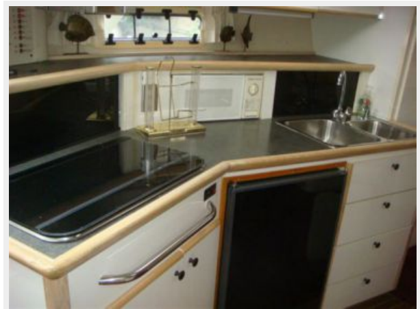
32' Maxum Galley Photo1