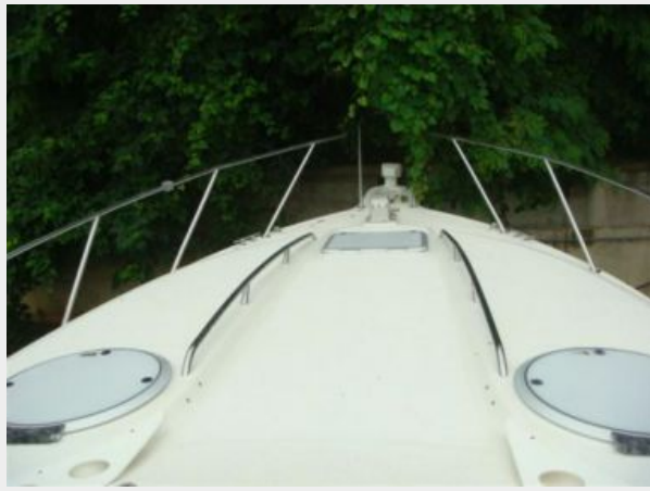
32' Maxum Foredeck