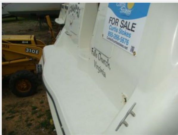
32' Maxum Swim Platform