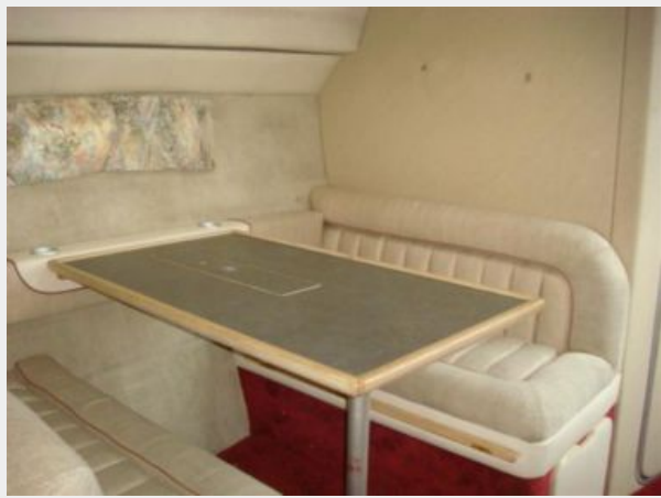
32' Maxum Dinette Photo2