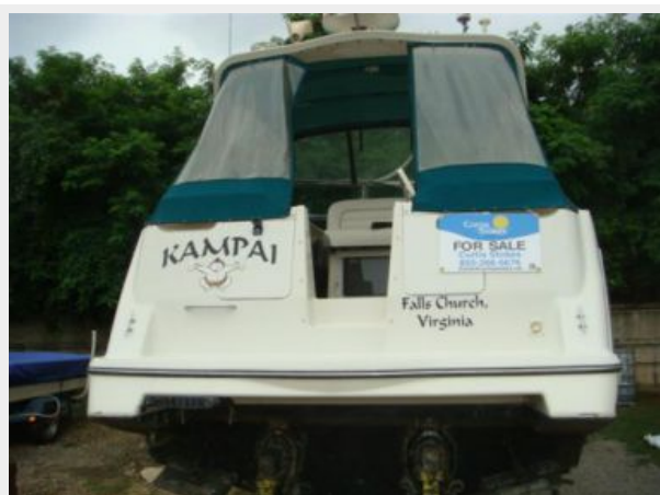
32' Maxum Aft Profile