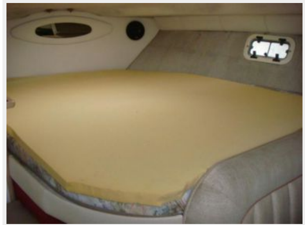
32' Maxum Master Stateroom