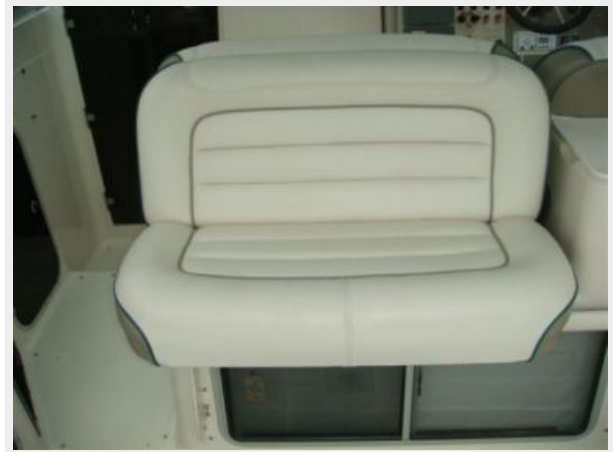
32' Maxum Upper Deck Forward Seating