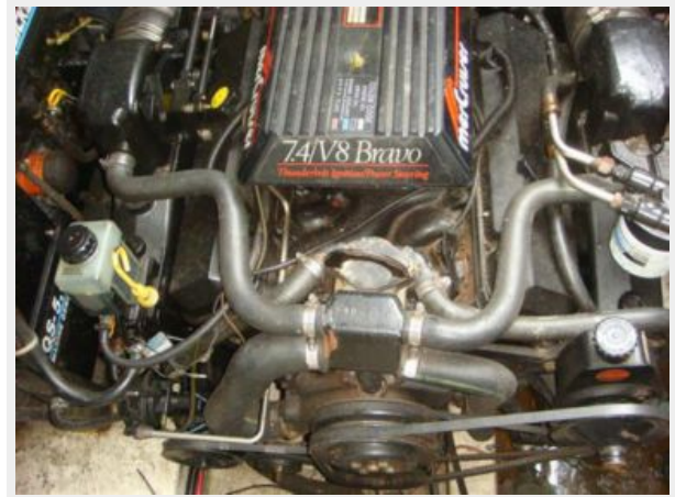
32' Maxum Port Main Engine