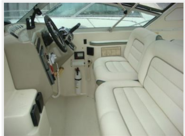
32' Maxum Helm Photo1