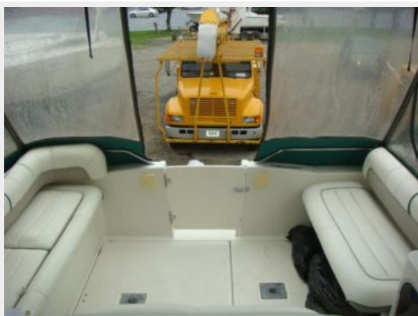
32' Maxum Upper Deck Aft