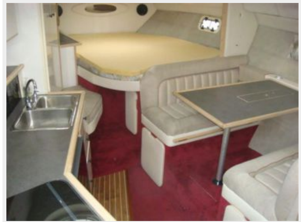
32' Maxum Lower Deck Forward