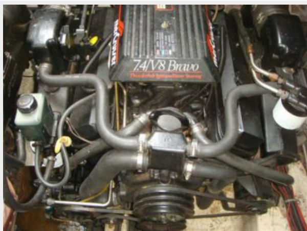
32' Maxum Starboard Main Engine