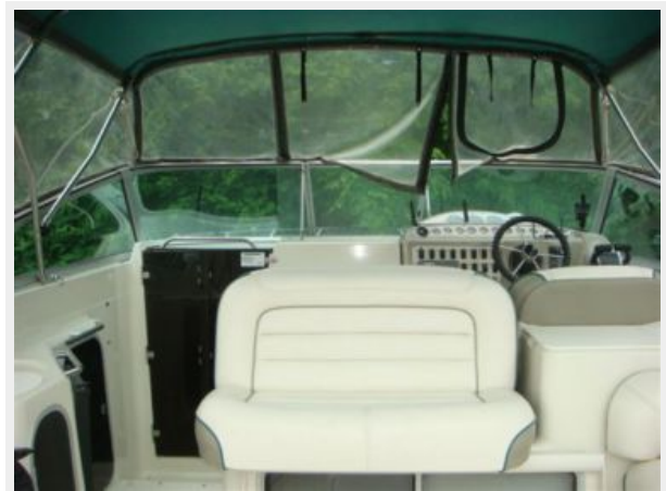
32' Maxum Upper Deck Forward