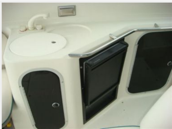
32' Maxum Upper Deck Wetbar