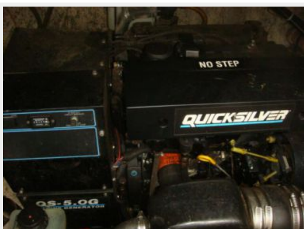
32' Maxum Generator