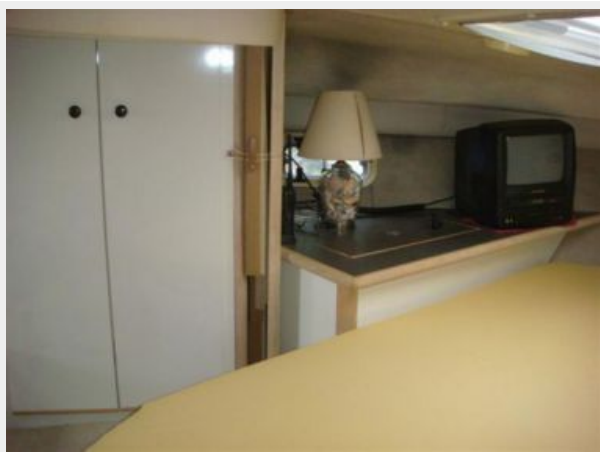
32' Maxum Master Stateroom Port