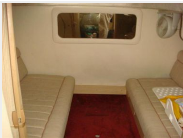
32' Maxum Aft Stateroom