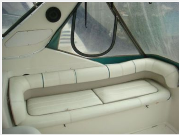
32' Maxum Upper Deck Starboard