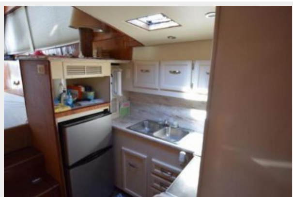
Galley looking aft