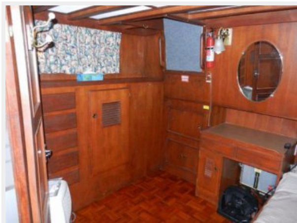
Generous lockers and drawers