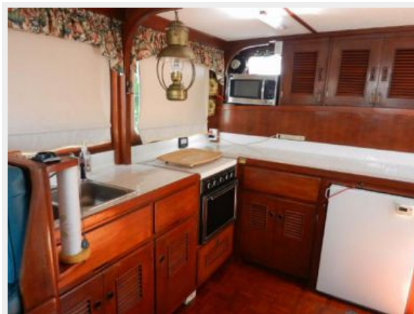
Galley View 2