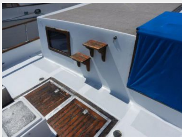
Aft deck and lazarette