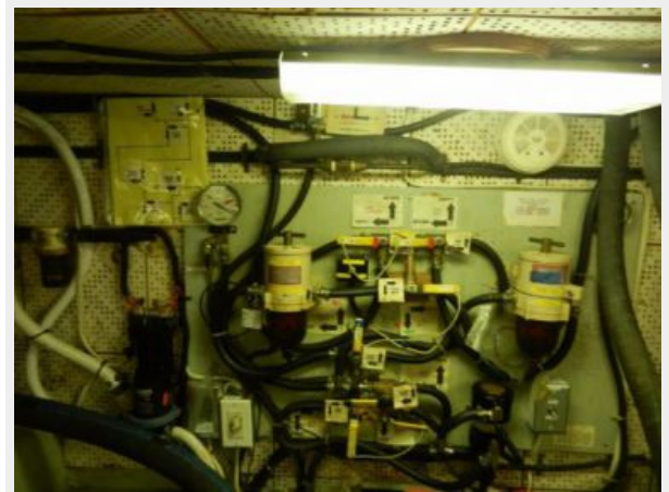
Fuel polishing system