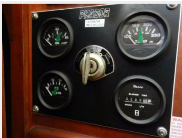
2235 Generator hours