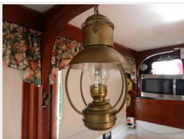
Original brass lamp