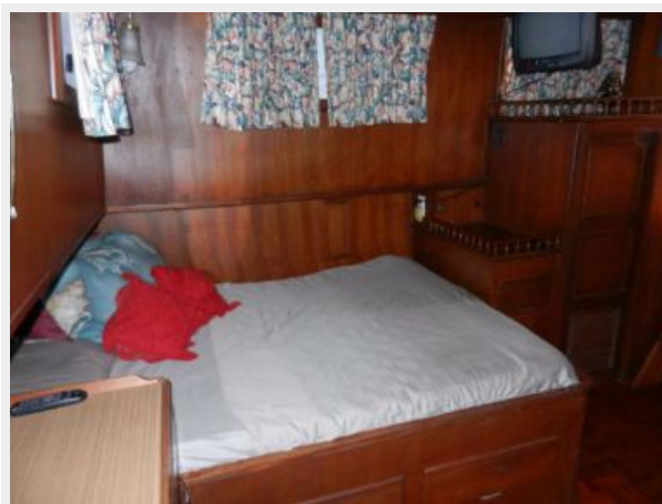
Master berth aft