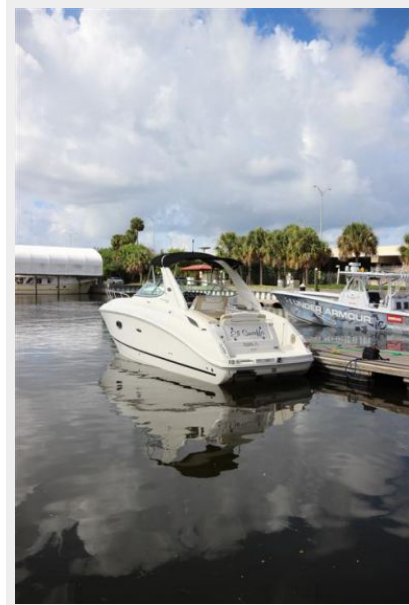
Port Aft Quarter