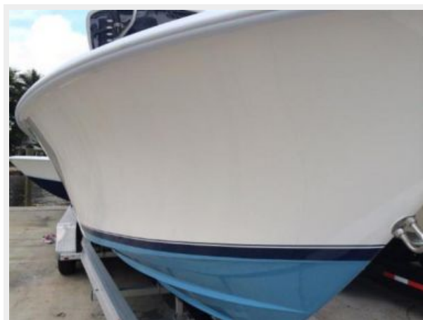
Sky Blue bottom, Aristo blue boot stripe