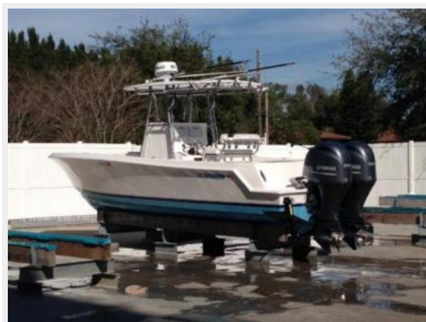
Contender 28 Sport