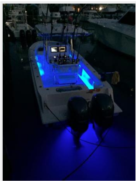
Contender 28 Sport