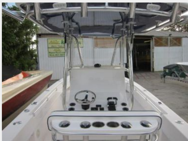
Contender 28 Sport