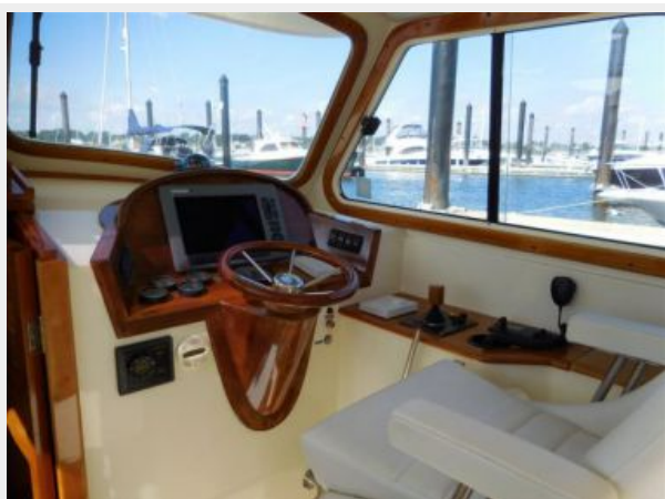
Cockpit helm area