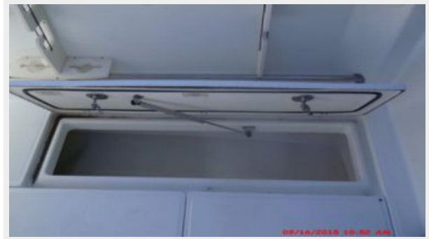
Cockpit / Fishing Equipment 5