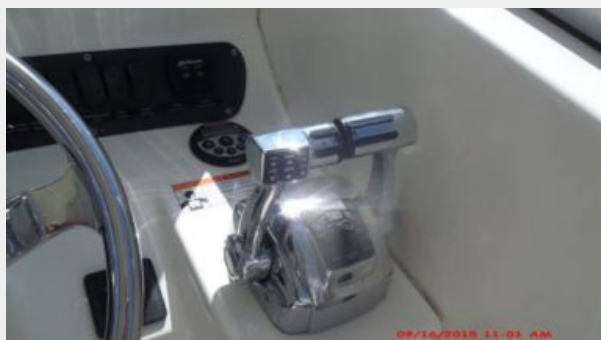
Helm / Electronics & Navigation 3