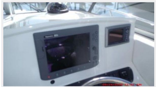
Helm / Electronics & Navigation 2