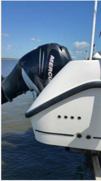
Engine & Mechanical Equipment 2