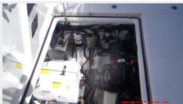
Engine & Mechanical Equipment 6