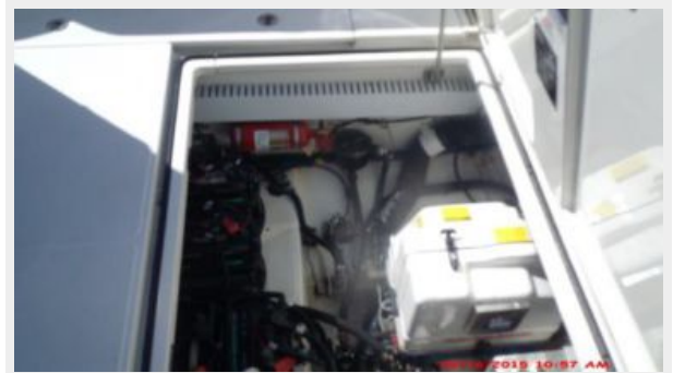
Engine & Mechanical Equipment 5