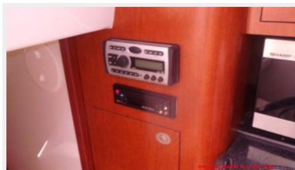
Main Cabin 3