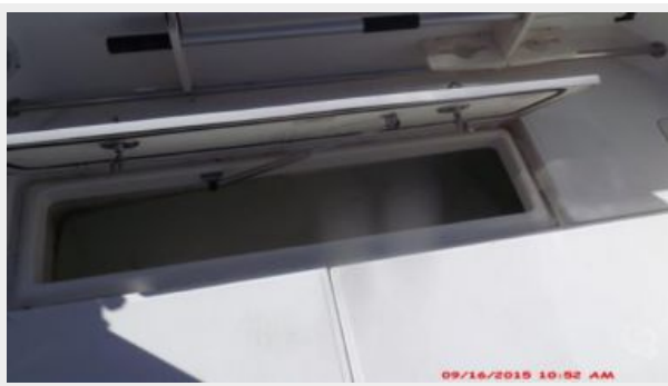
Cockpit / Fishing Equipment 6