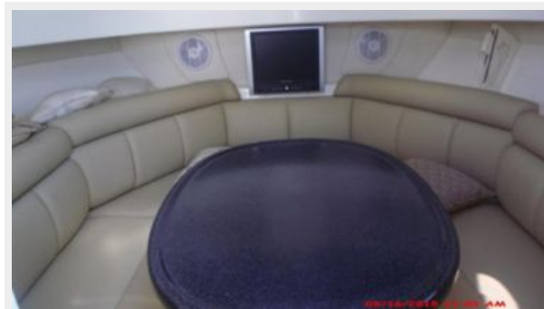
Main Cabin 1