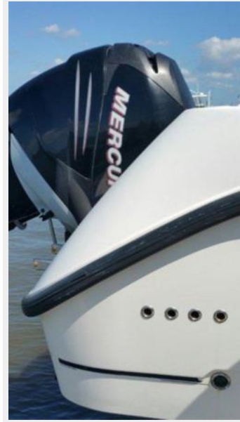
Engine & Mechanical Equipment 3