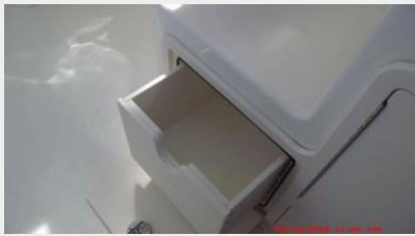
Cockpit / Fishing Equipment 4