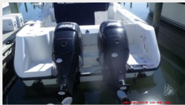
Engine & Mechanical Equipment 4