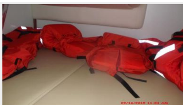
Main Cabin 2