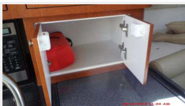
Main Cabin 4