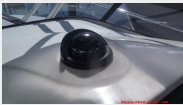
Helm / Electronics & Navigation 1