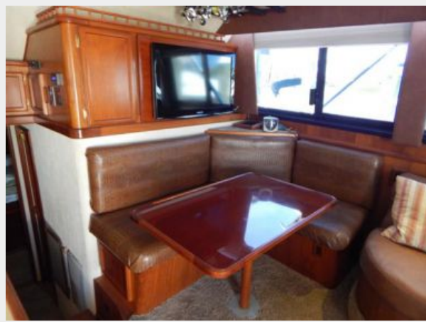
Starboard Salon 1